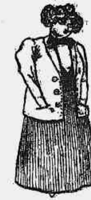
D. PLACIDA ANACHRONICA

Esta senhora além de excellente jornalista, toca rabeça admiravelmente.