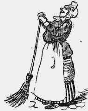
D. SILENCIOSA TAGARELA

Pará enorme successo com a habilidade que tem de metter o nariz em todas as bechás.