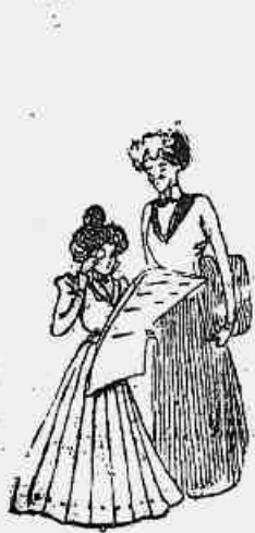
D. MASCULA TELHUDA (Directora)

D. Minima Pernalta, secretaria, muito entendida em assumptos secretos.