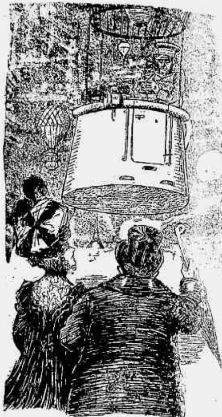
A scena se passa no anno de 2000, quando houver torres Eiffel por toda a parte e os carros de praça forem substituidos por aerostatos. Diz o velho commendador: — Poderiamos tomar aquelle balão, mas creio que elle já está sem gaz, não se levanta mais. — Qual! diz-lhe a mulher: peusas então que tudo é como vez? ...

CIGARROS descobridores— Vendido.— Collecção guerreiros historicos, Santo Angelo, typos da rua, Benedictinos, peitoraes e frades.