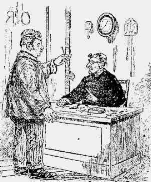
Em casa de um relojoeiro: — O patrão mandou-me trazer a vocemeccê esta penduea para ver o que tem ella, porque o relógio atrasa meia hora. — Tão burro é você, como é o seu patrão! Pouha-se lá tãô!