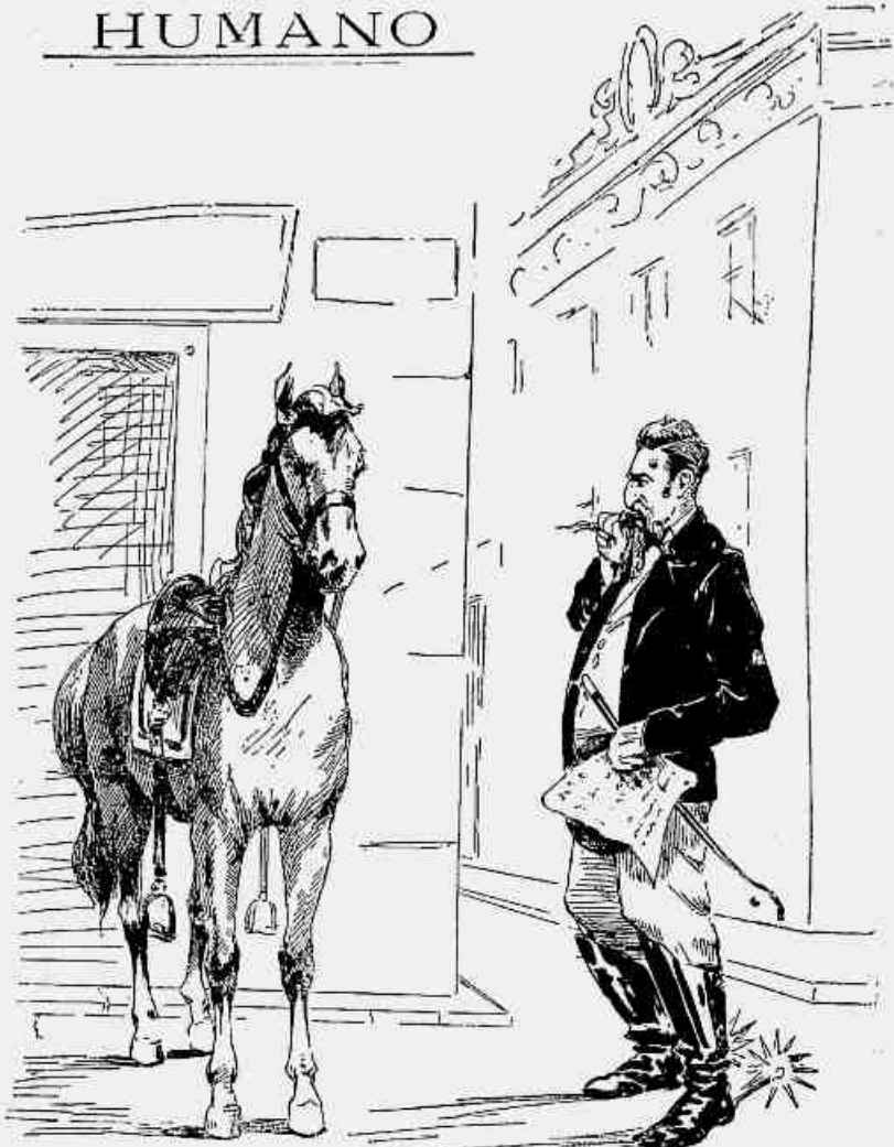
Como este cavallo te a boa estampa, mas é perigoso, pois já me fez dar tres tombos, vou mandal-o ao Dr. X., que faz annos amanhã. Merece um presente porque a elle, deu a fortuna de não ter mais sogra. Foi quem passou o atestado e não me levou dinheiro pelo tratamento .