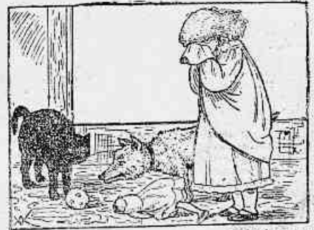
6) E foi com grande pesar que a Lili viu a sua Lili com a cabeça separada do tronco, como si tivesse tomado parte na revolução Oriental...