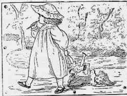
2) D'ahi a momentos a pobre Lili era arrastada por uma porta pelas alamedas do jardim.

— Pois bem, embrulhe-a. A minha Lili está ficar contentissima! E faz gosto dar-se-lhe um brinquedo, ella é tão cuidadosa!