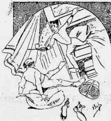
(4) ... uma chicara de chá!

Diz-lhe-ha: "Desfolhou-a o vinho ! Enfim veremos o que sahirá daqui. DR. COCAINA.