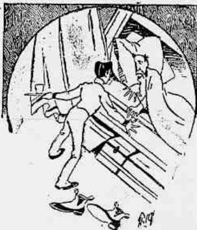
(2) ... para apresentar a um pobre...