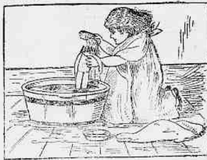
3) Depois mette-a no banho e com uma escova elison-lhe os capellos. Os effeitos dessa lavagem não tardaram a se fazer sentir.