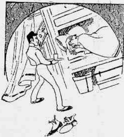
(1) A agilidade que se exige de um criado...