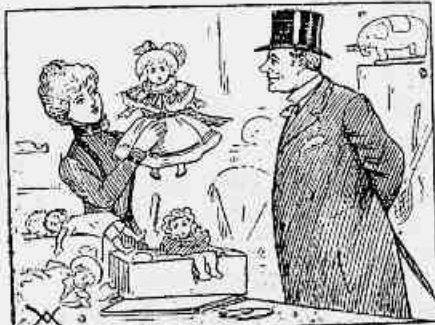
1) — Leve esta boneca, senhor. É a mais bonita que temos.