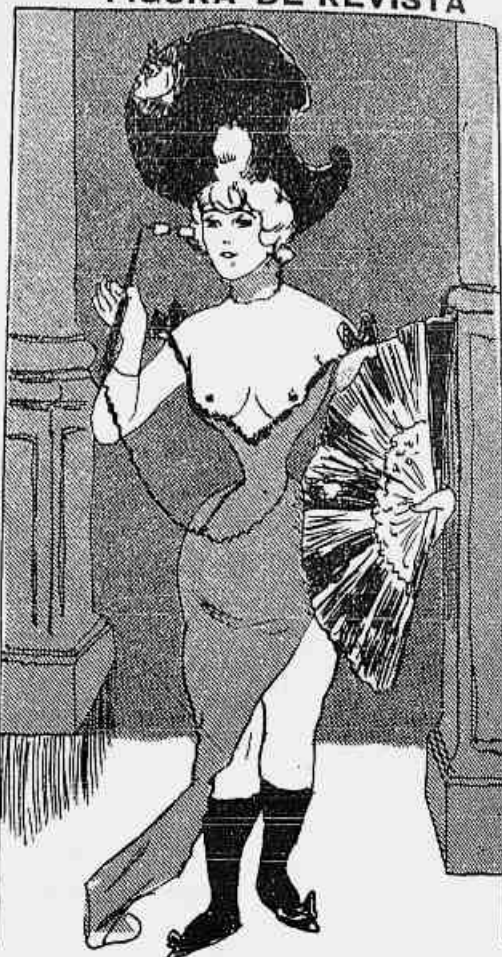
FIGURA DE REVISTA

Senhores ! Sou o Art-nouveau , Inverto a ordem das coisas Creação interessante E o meu prazer é mudar Da actualidade brillante. As coisas mais diferentes. Transformando agora estou. Por isso é que agrado ás gentes As praticas carunchosas, Que gostam de variar.