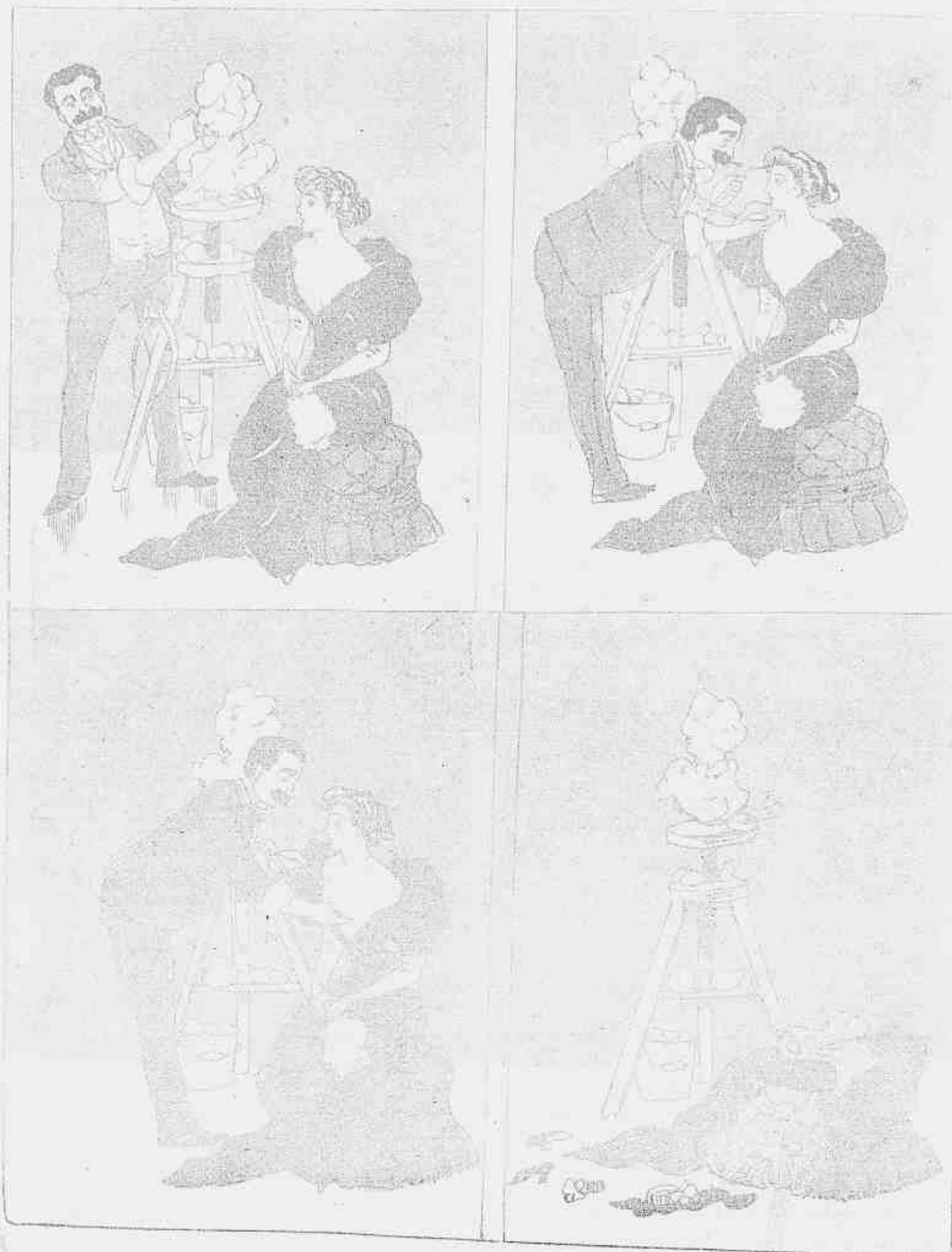
Escultura que qualquer um faz no quarto... quadro.