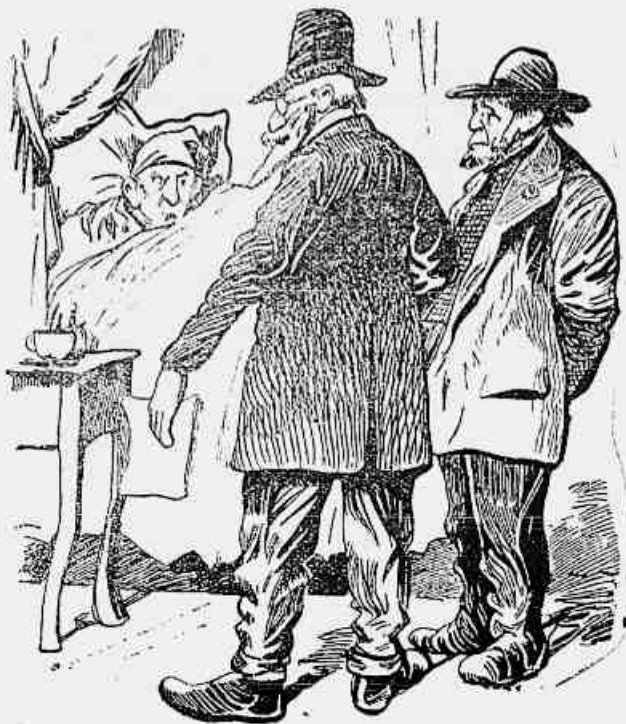
O medico — Com esta fraqueza voluntaria o senhor não fleará bom Vamos, tenha forza de vontade, endureca. O doente — E' completamente impossivel. Na minha idade ninguem ainda conseguiu endurecer, assim com duas razoes.

Quereis gastar bellas horas de prazer? Vinde comprar os CONTOS FRESCOS A 1. a em nosso escriptorio