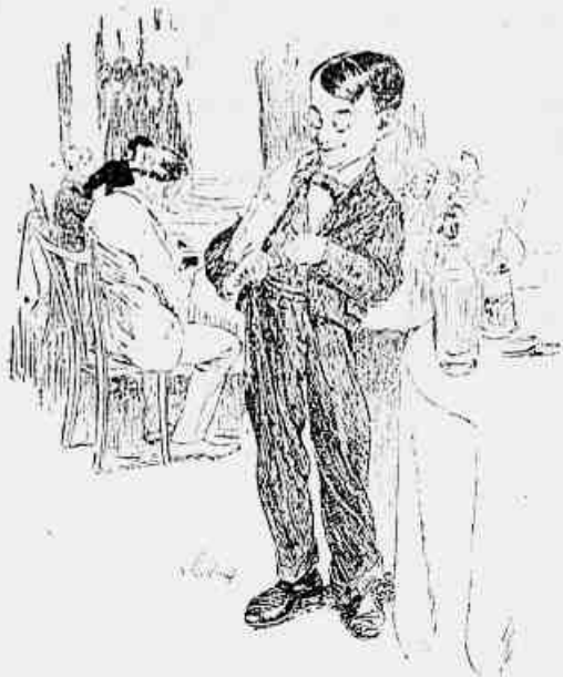
— Aquella freguez que nunca me dá gorjeta, pagar-me á hoje na conta do almoço. Por desaforo vou carregar-lhe nos ovos.

Quereis gastar bellas horas de prazer? Vinde comprar os CONTOS FRESCOS A 1. a em nosso escriptorio