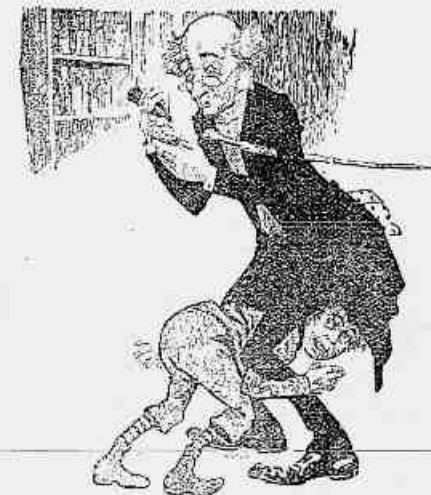
— Que brincadeira são essas menino, com um corpo estranho entre as pernas calcei com certeza. — Não se encommode estou fazendo o que papai faz todos os dias com sua mulher.

— Ah! — Está dito? — Estava dito porque effectivamente a mulher do Pontes com o coraço ulcerado, foi uma primeira vez á casa do charuteiro. — Estamos quites! Disse o Pontes a seu credor, quando as tres visitias foram feitas. — Ainda não! exclamou a mulher, calculando os meus favores a 53 cada vez, o senhor ainda não está de todo pago, visto que recebeu 15 mil reis falsos — e só duas vezes se pagou.