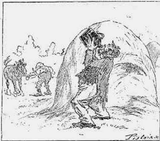
3) — e é para já, vou beber tanto quanto puder!...