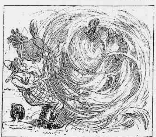
6) — O que vejo?!... Santo Deus!... que será isto?!... o Gomes a fugir! a baranca a mexer-se!... ouço gritos!... estou perdido!... Valha-me Nossa Senhora da Piedade.