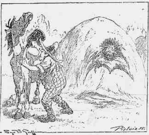
5) — O alveitar — Ah!... se com esta droga toda, não ficamos bom, então és um burro insupportavel, e nesse caso mando-te fazer companhia ao diabo.