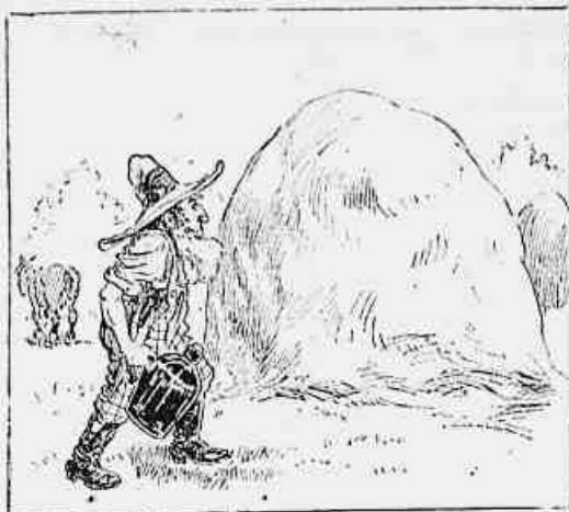
1) — O alveitar — Bem, fica aqui o garrafão de mercúrio com espirito e agora vou lusear o burro para o curar.