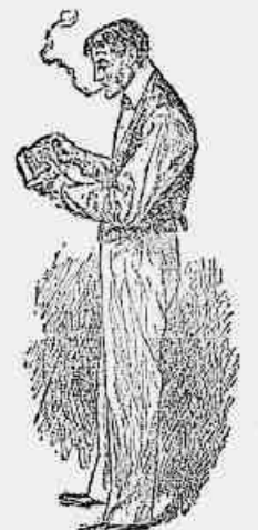
1 — Oh! É um presente para mim?! Vejamos o que contém esta caixinha tão bonita...