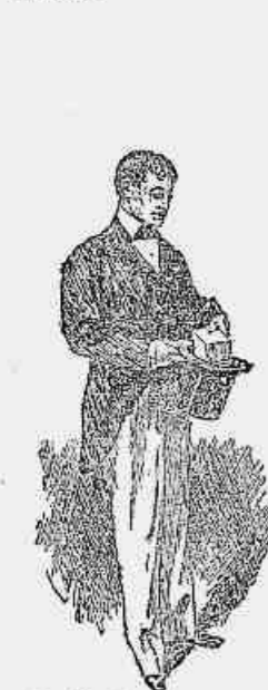
3 — Vou levá-la para a Be-partição, afin de me divertir com os collegas. Como não cabe no bolso, metto-a na cartola.

TONICO JAPONÊS. — É o melhor preparado para perturar o cabelo e destruir o parasita, evitando, com seu uso diario, todas as enfermidades da cabeça.—Rua dos Andradras n. 59.