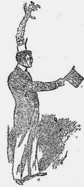
4 — Eis que na rua o nosso he-partição, afin de me divertir com os collegas. Como não cabe no bolso, metto-a na cartola.

5.ª COLLECCÃO Já está á venda a 5.ª colleccção e Monologos, Cançonetes e Modinhas escolhidas entre as melhores que temos publicado.—É um grande volume de cento e tantas paginas, impresso em typo bom e legivel. — 18000 réis cada volume. — Pelo correo e duas agencias do Rio Nu no interior e nos Estados 18500.