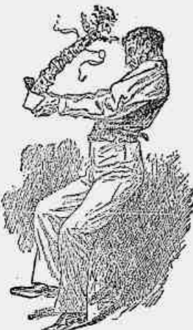
2 — Ué... Um boneco de moças! É bem sacada, é bem sacada! Como dizia o outro.