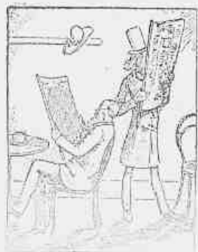
4.—Quê! Que há perdido, não tem o jornal? Não, não está aqui. Está lá. Be preparado. Agora se machuca os dedos quando lê o jornal.