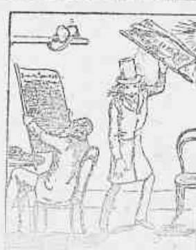
6.—Como não tem o jornal, não tem que se machucar com o jornal, não machuca com o jornal, não machuca com o jornal, que grande bobagem!