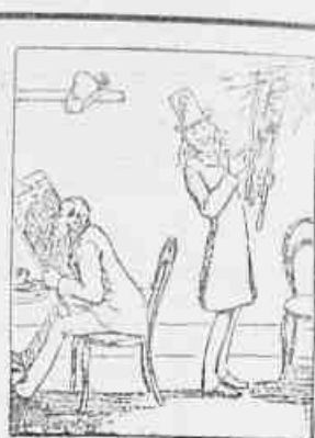
3.—E' melhor eu ler o meu jornal socegado... Mus... que diabo! Esse bruto está me tirando parte da luz e eu não enxergo para ler.