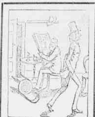
1.—Arre! Que sujeito estúpido! Entra, deixa a porta aberta, tira as cadeiras ao chão, parece que entrou numa estrebacia!