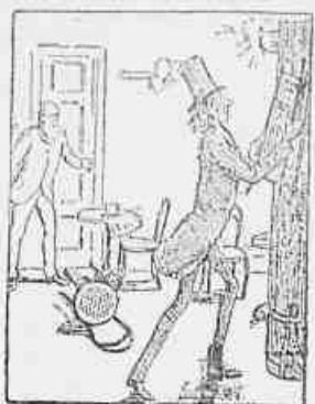
2.—Onde irá esse cão? Ah! Vai ler os jornaes, vai direto ao Rio Nu; naturalmente vai procurar alguma nota na carteira.