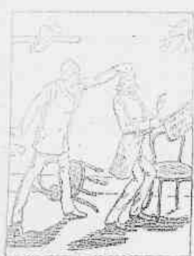
7.—Filho da... Purca! Toma!