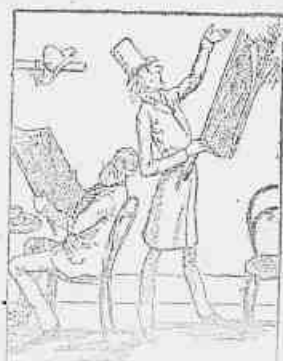
5.—I tem o jornal, se machucou com o jornal, não tem que se machucar com o jornal, não machuca com o jornal, que grande bobagem!