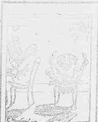
9.—Enfim, posso ver socegado...