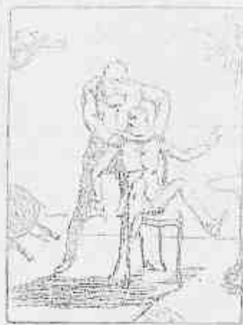
8.—Só se machuca com o jornal.