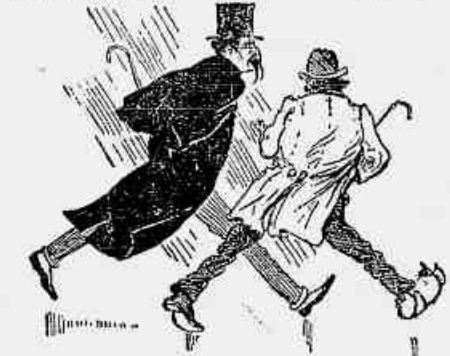
(3) A VICTIMA. — Que tal o aleijado? O MENDIGO. — Não posso ter-me nas pernas por muito tempo!