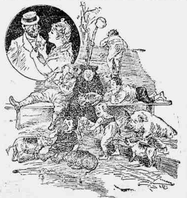
— Então a menina quer que eu a proteja? Mas diga: de quantas pessoas se compõe sua família? — Contando commigo, o papai, a mamã, meus irmãos e a criação, somos apenas quatorze...

ALLIUM SATIVUM. — De J. Coelho Barbosa & C., rua dos Ourives n. 83 — Rio de Janeiro, o qual se vende em todas as farmacias do Brasil. Tomando seis gotas em meio copo com agua, de uma a vez, á noite ao deitar-se, é um grande microbocida. Mata o microbio da influenza de um a tres dias e cura todas as molestias que têm por causa um resfriamento. — O legitimo tem um coelho pintado.