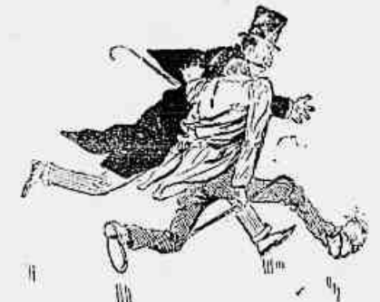
(2) A VICTIMA. — Não ha remedio, não apressar o passo! O MENDIGO. — Eu sou um pobre aleijado que apenas pôde mover-se!