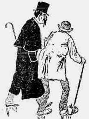
(1) O MENDIGO. — Uma esmola para um pobre aleijado! A VICTIMA. — Não tenho trocado! Irai! Que sacra!