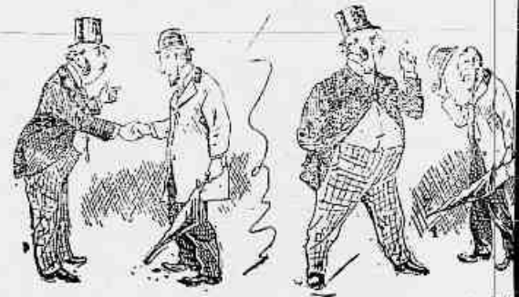
No dia da eleição. — Conto com seu voto, hein! — Ohe que não me esquecerá do senhor! — Fique descansado, doutor. Seis mezes depois de eleito. — Sr. doutor, bom dia! — Bom dia, meu amigo, não poder poder attendê-lo a pressa.