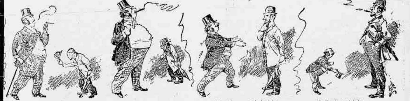
Um anno depois de eleito. — Sr. doutor, pô-lo me fazer u na paravrinha? — Impossivel, agora! Vou para a sessão. Dois annos depois de eleito. — Sr. Doutor, si V. Ex... — Mas quem é o senhor? Não tenho o prazer de conhecê-lo! No ultimo anno da legislatura. O CANDIDATO. — Oh! meu grande amigo! Como vai essa bizarreria? O ELEITOR. — Ben, obrigado. Adeu! No dia d' eleição. O CANDIDATO. — Posso contar com o seu voto, não? O ELEITOR. — Si; mas que mais, seu Aquelle? Fomeite-se!