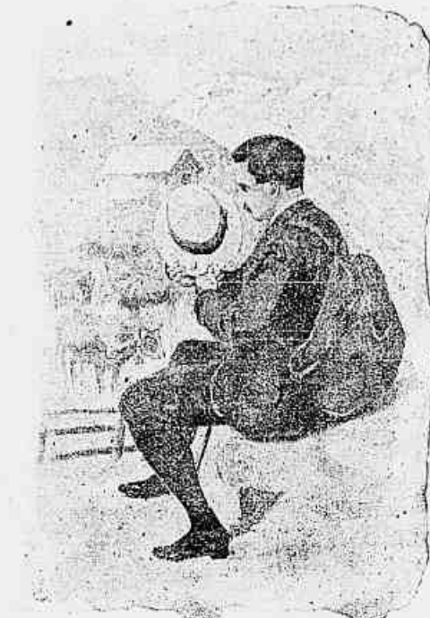
O rouliste (examinando o chapéo sobre cuja aba um passarinho deixou cair uma lembrança). — Felizmente foi um passarinho e não uma vacca...