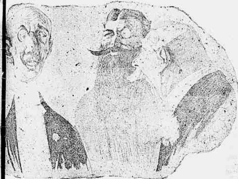
— Que diabo é Gervasio. Continúa cada vez mais calvo! — Pois, elha; depois que casaste, sempre pensei que te nascesse algum... na cabeça.