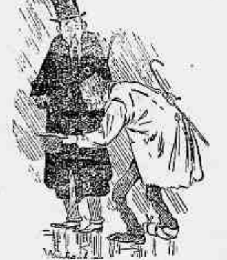
(4) A VICTIMA. — Ah! tem, homem, e deixe-me em paz! O MENDIGO. — Obrigado! Deus o livre de outro aleijado como eu!