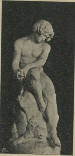
O Desterrado é a Esfinge da Raça... (Pag. 13)

Deu entrada em 20 de Antechy de 19 15 Senz