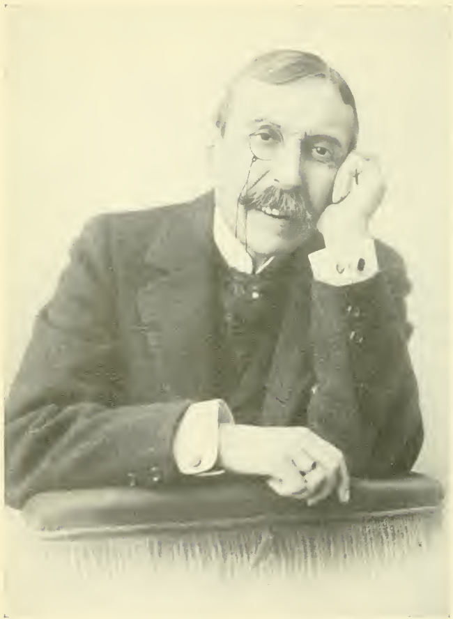
EÇA DE QUEIROZ