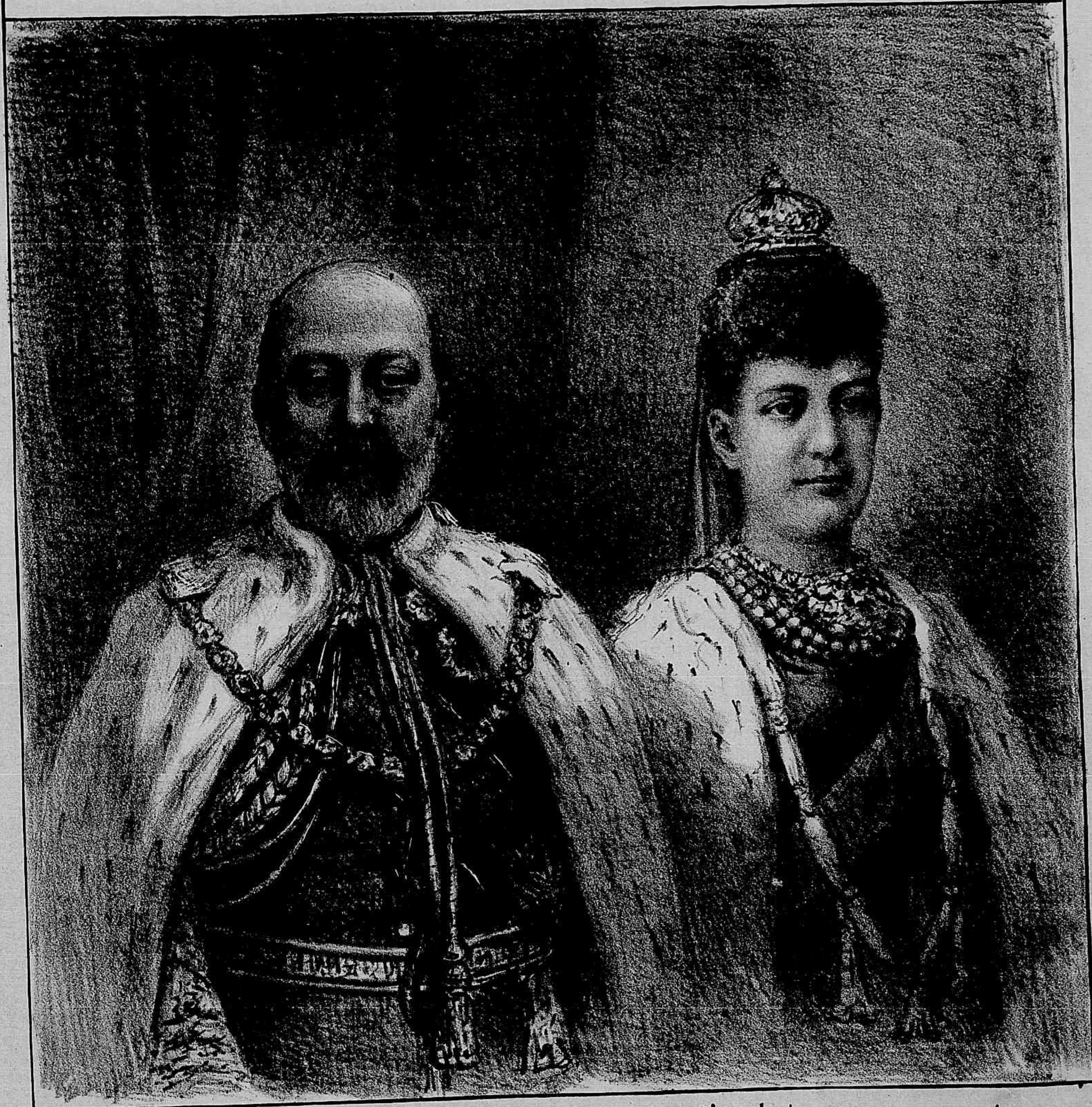
O rei Eduardo VII e a rainha Alexandra de Inglaterra, coroados no dia 9 de Agosto de 1902