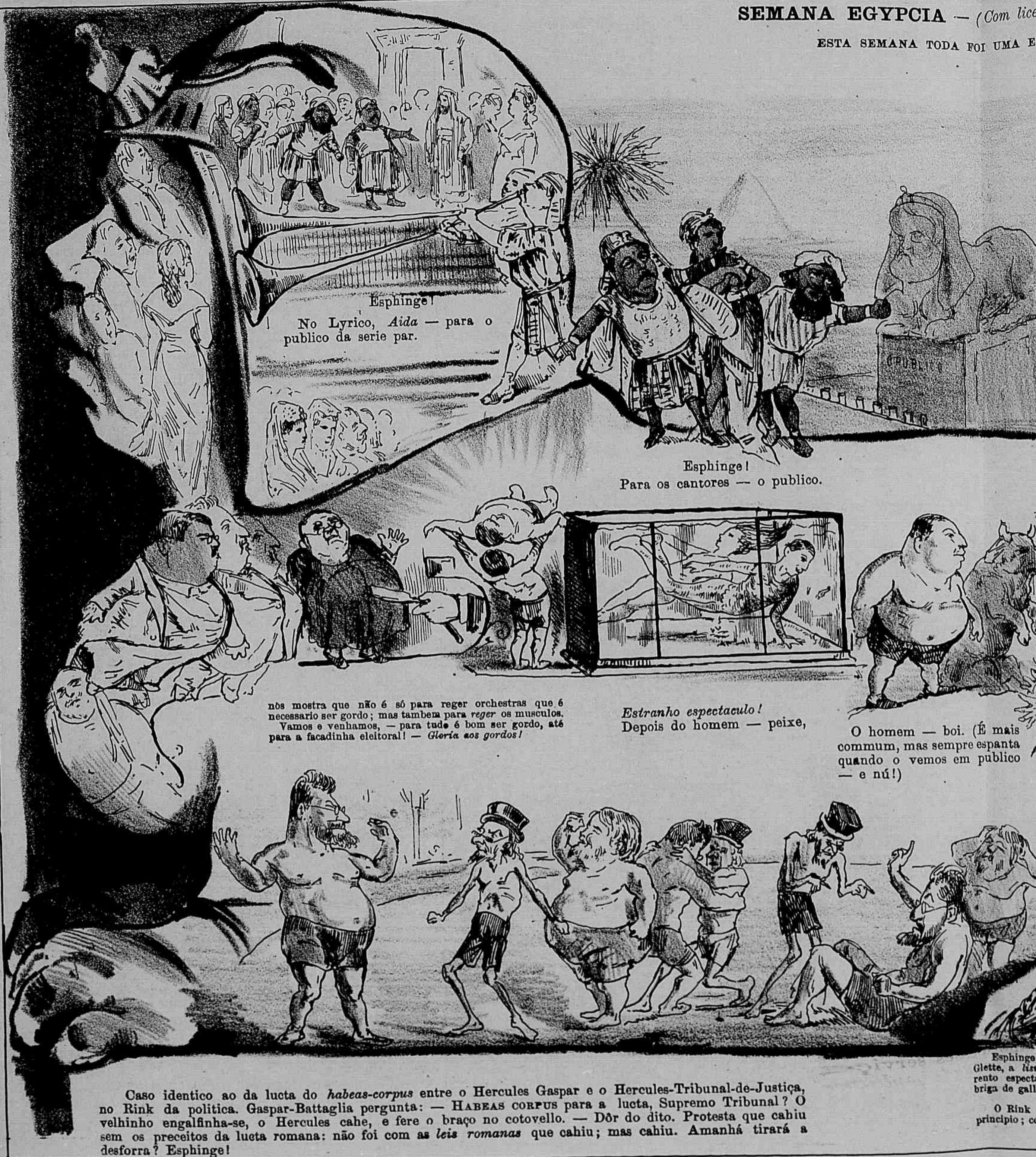
Esphinge! No Lyrico, Aida — para o publico da serie par.