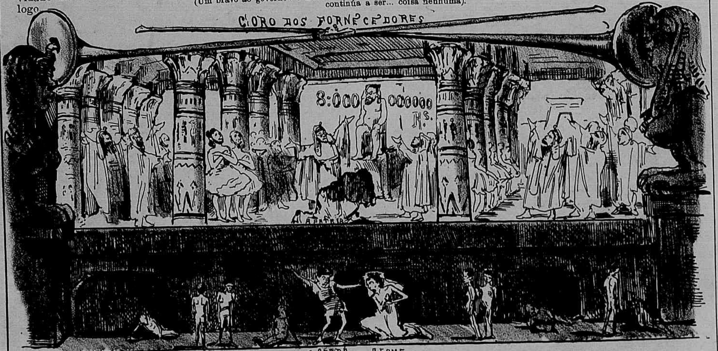
- O CERRA - AFOME -

A scena final da Aida affigurou-se-nos uma scena da sêcca em que os fornecedores (fallamos dos deshonestos) entoam canticos aos 8,000 contos, emquanto aquelles a quem o governo destina os soccorros estão, como Rhadamés e Aida — na fome e na escuridão.