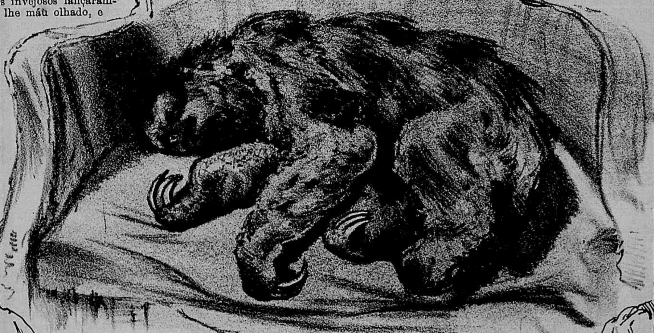
FIEL RETRATO DA NOSSA PREGUIÇA DEPOIS DE MORTA.

ella, coitadinha! não tendo dedos, não poude fazer assim (figas) para desviar o quebranto:— morreu.