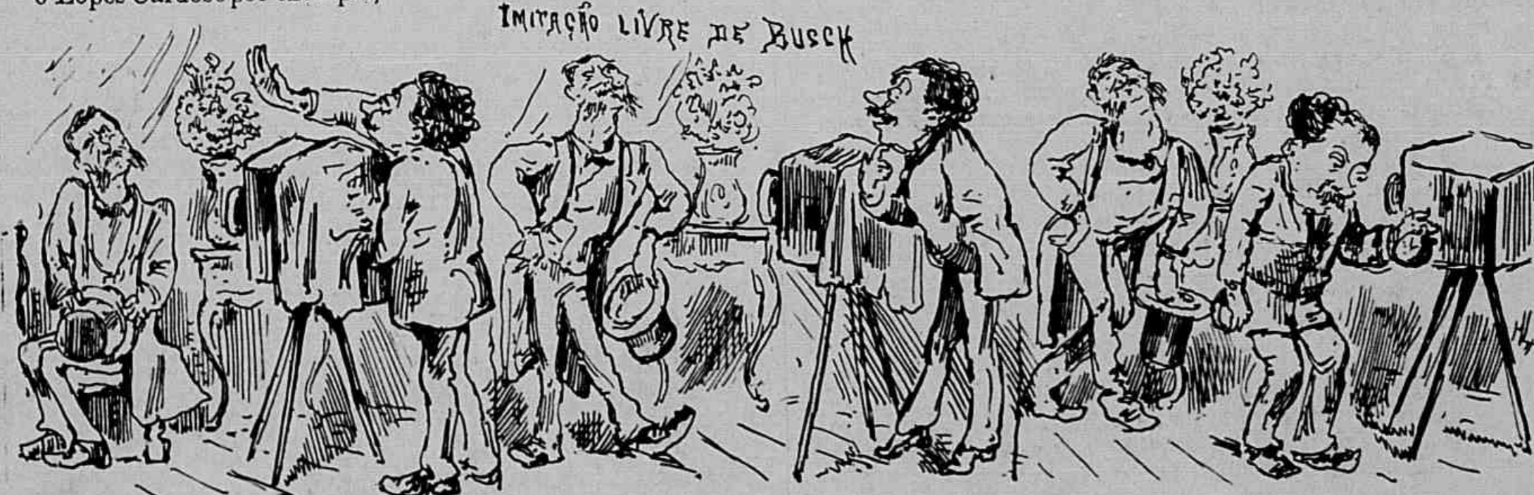
A cabeça mais para alli. Assentado não vae bem.