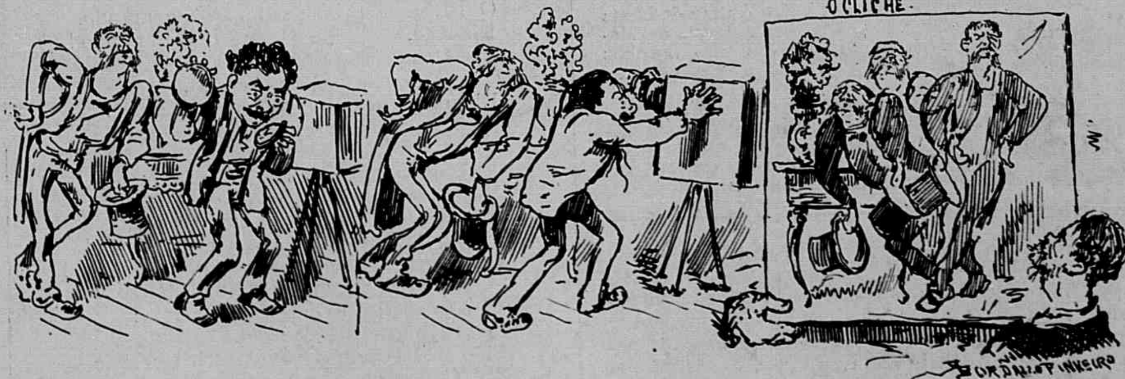
Um, dous, trez... (O Fagundes descae).