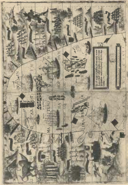
LE GRAND GOLFE DE CHINE, d'après les Reinel. — Bibl. Nat. de Paris, cartes et plans Ge. DD. 683. (Orig. 0,28 m. — 0,19 m.)