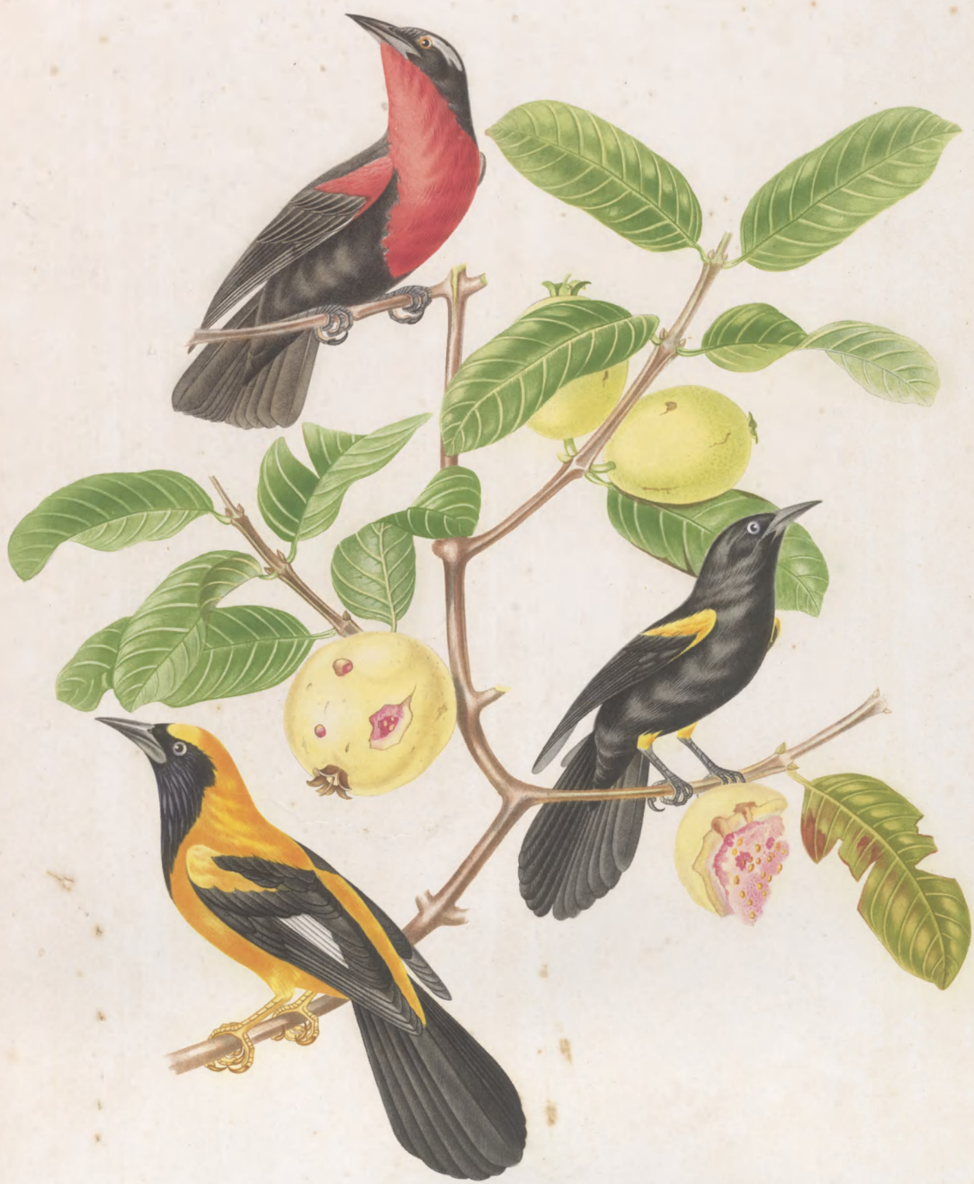
TERNIS AMERICANUS XANTHOPUS FEMORALIS JAMACI