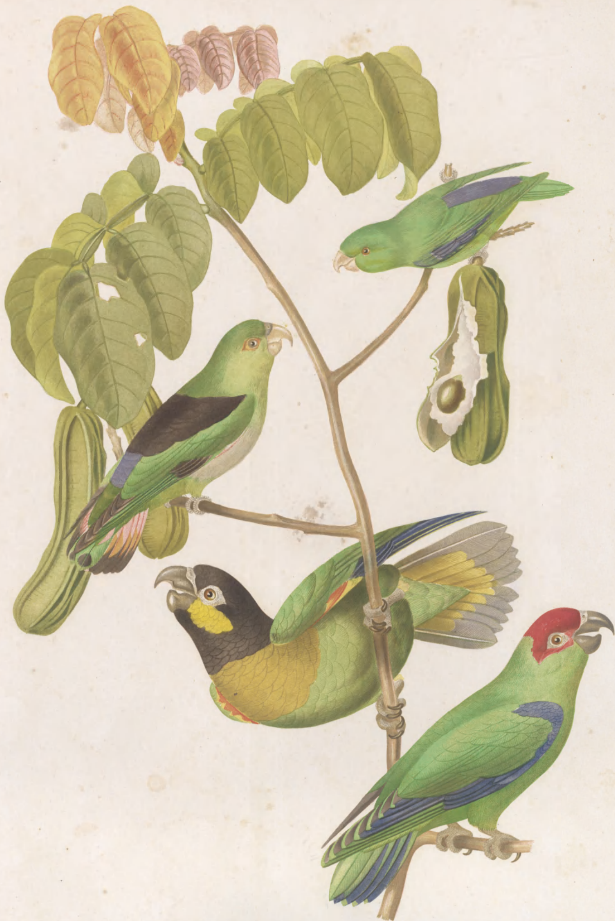
PSITTACULA PASSERINA. ——— MELANONOTOS ——— PILEATA. ——— MITRATA