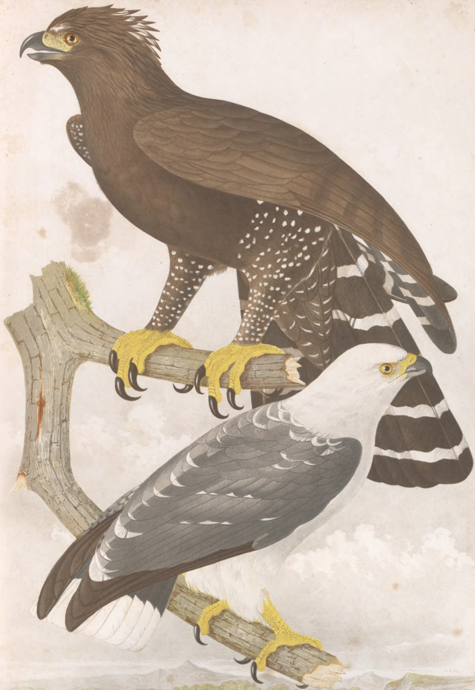
MORPHNUS BRACCATUS †