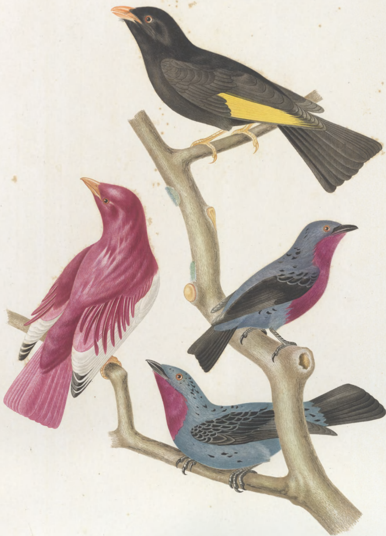
AMPELIS CHRYSOPTERA ——— POMPADORA ——— COTINCA ——— CAYANA