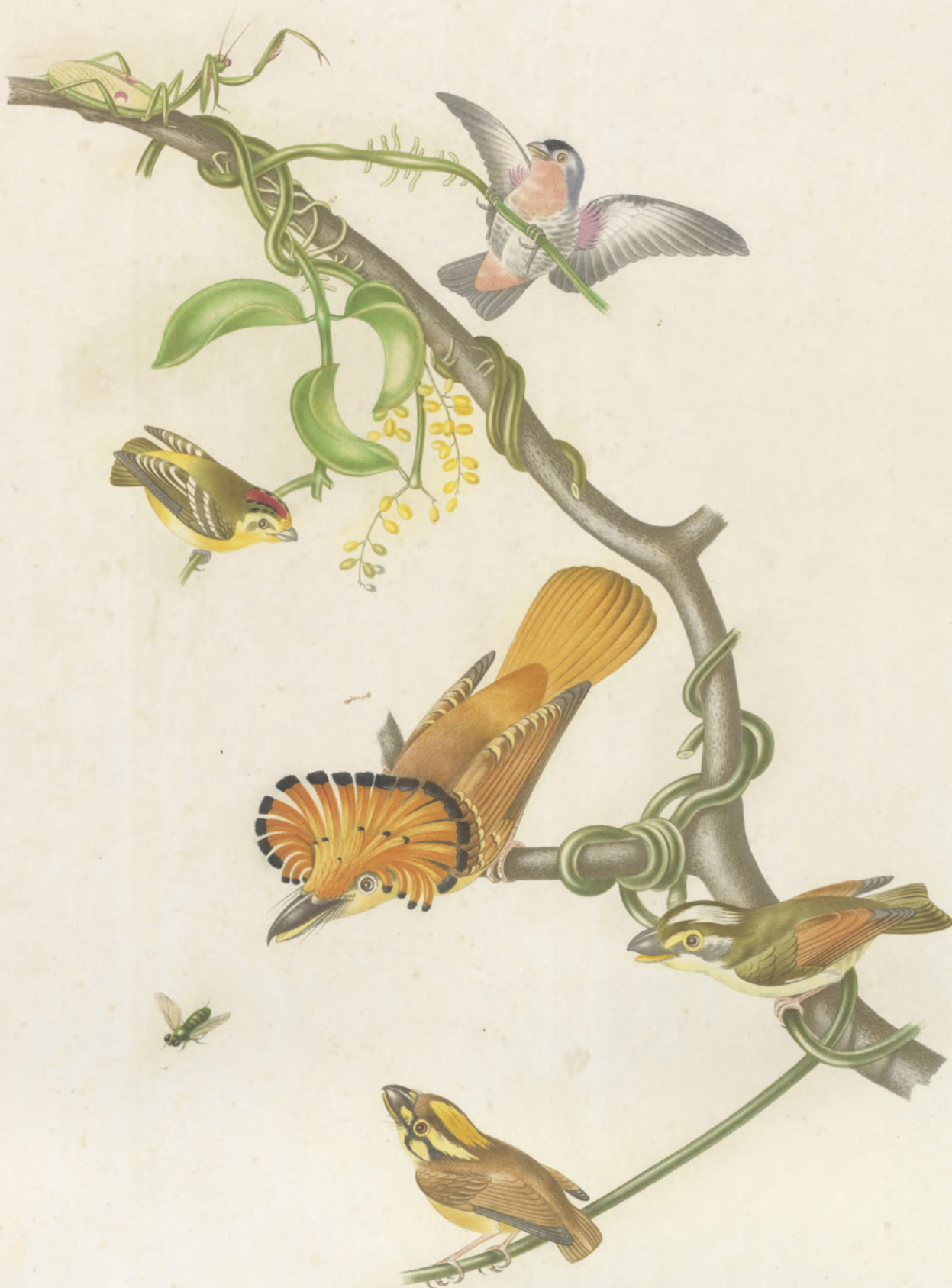
HELIOPHILUS TAUNAYSII PARDALOTUS CORONATUS. PLATYRHYNCHUS REGIUS. _____ ALBOCAPILLUS. _____ CANEROMUS.