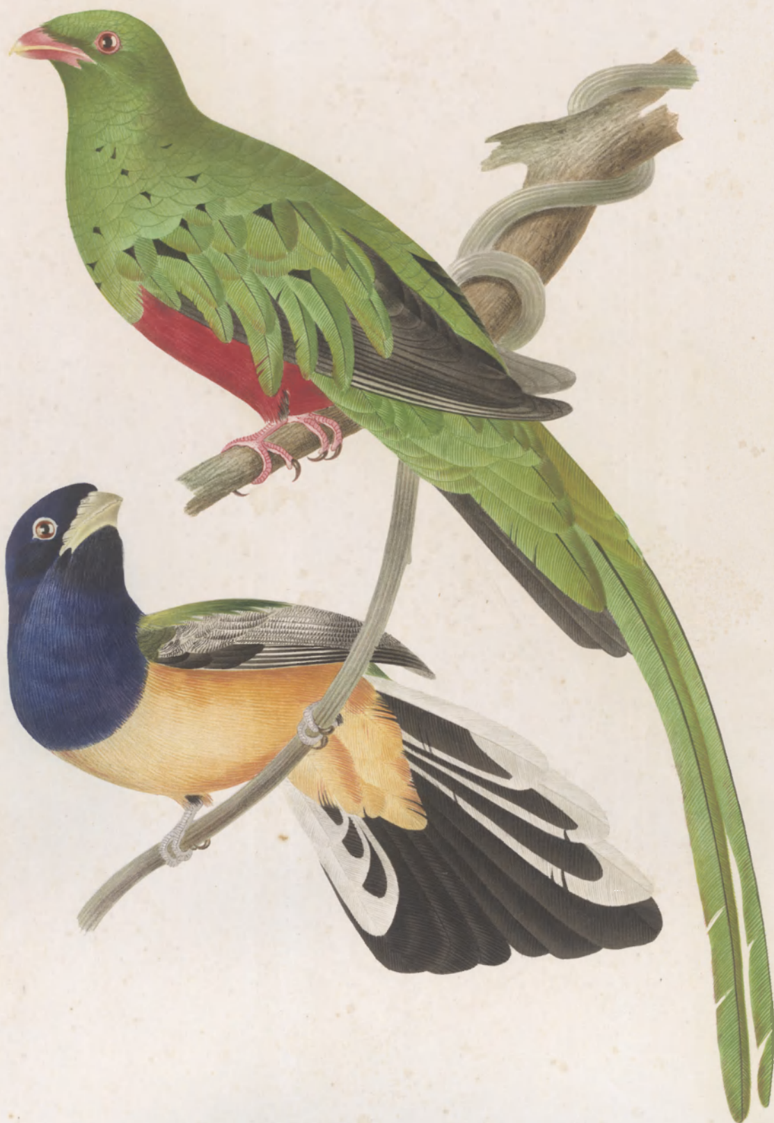
TROOON PAVONINUS AURANTIUS

LONDON: PICTORUM & SOCIJS CARBON LITHOGRAPHERS