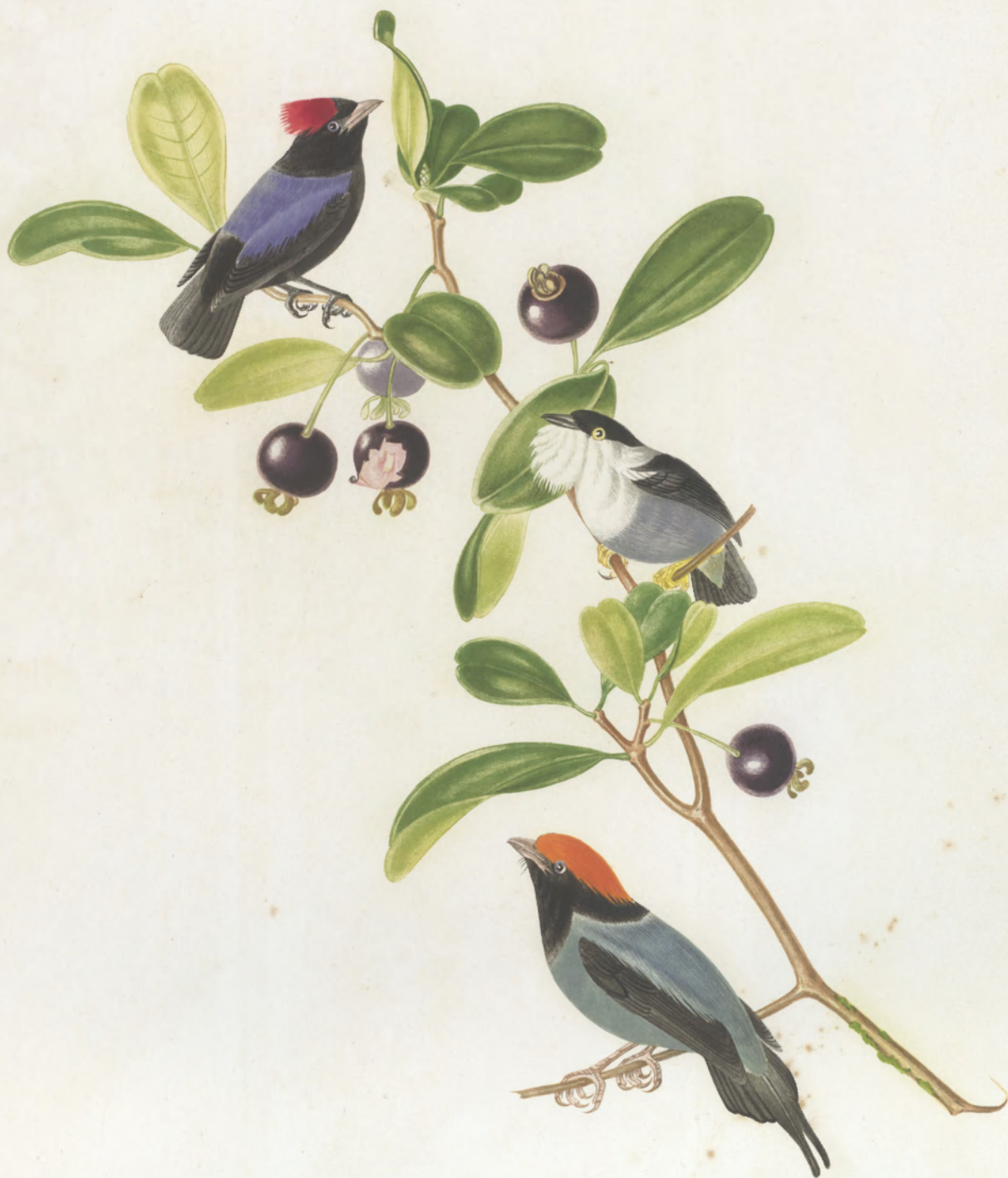
PIPRA PAREOLA ——— CUTTUROSA ..... CAUDATA.