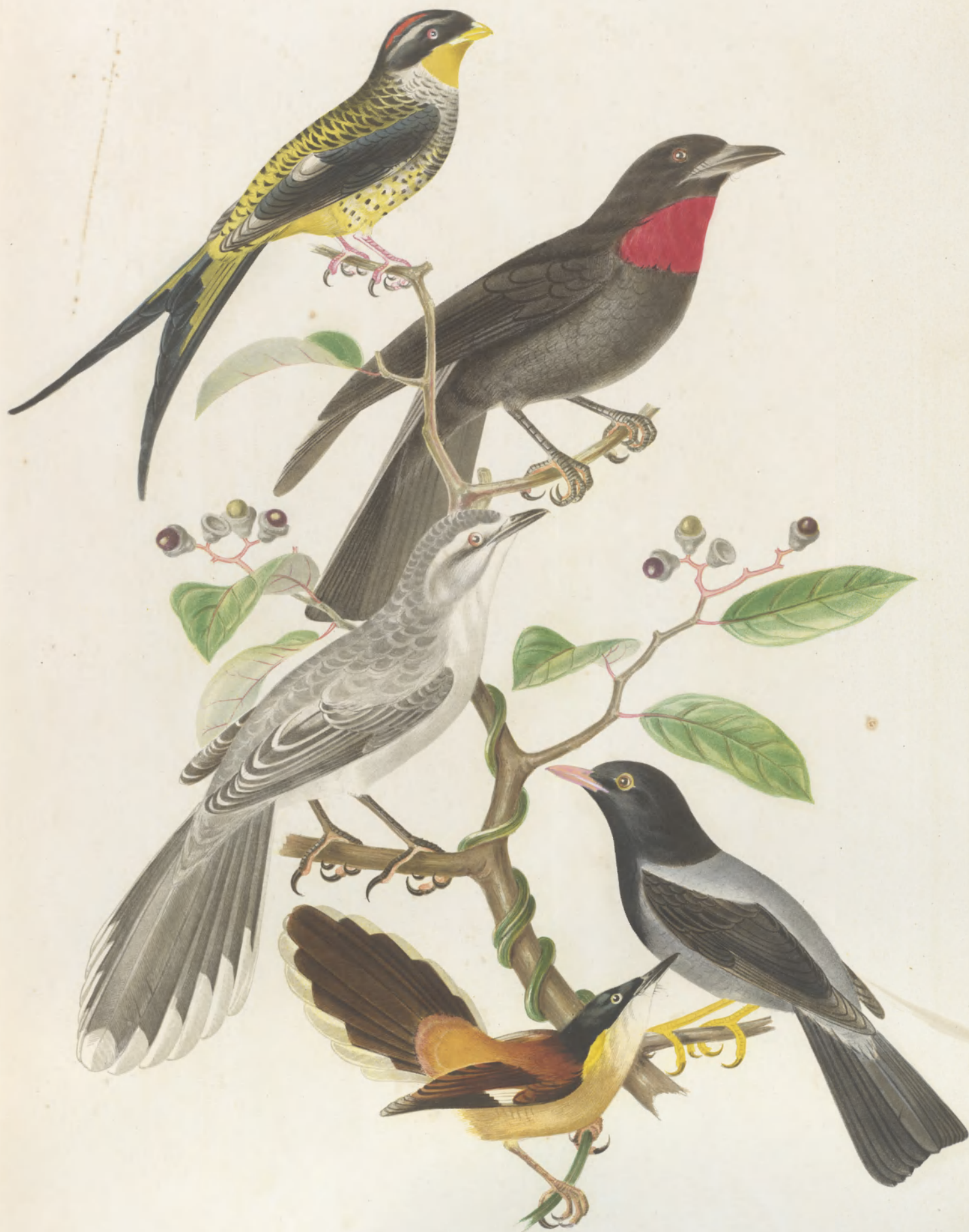
PHIDATURA FLAVIROSTRIS QUERULA RUBRICOLLIS TURDUS ORPILUS ——— FLAVIPES ——— BRASILIENSIS.