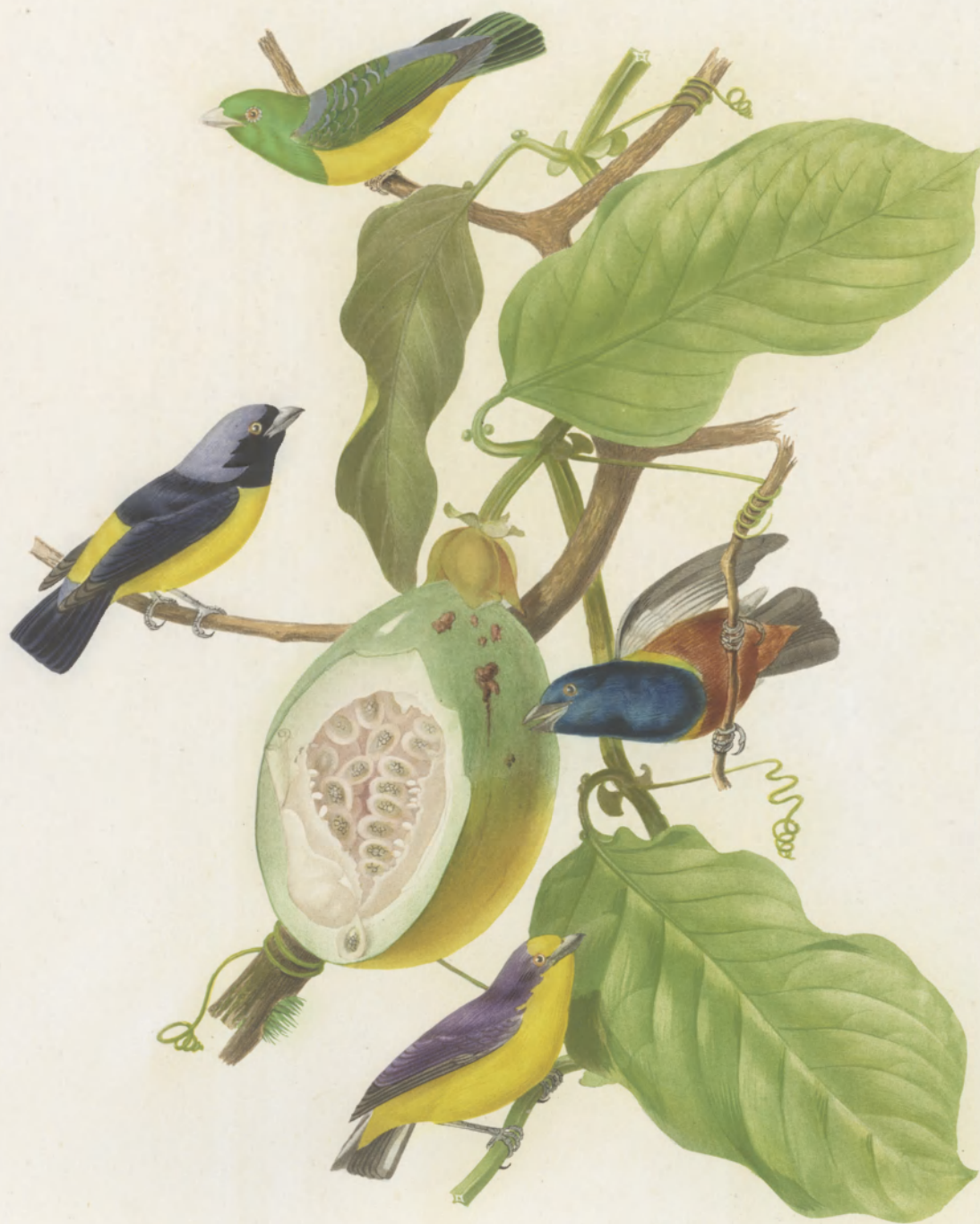
EUPHONIA GALOTI — CYANOCEPHALA — CAYENNENSIS — VIOLACEA