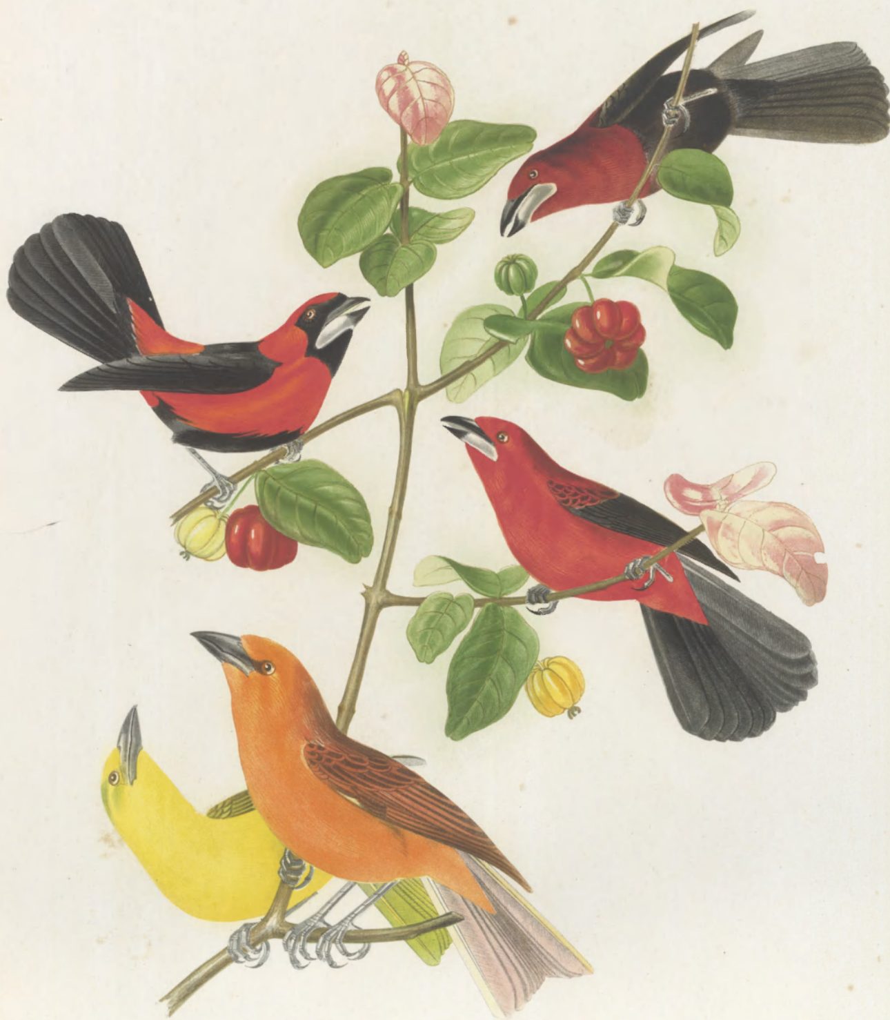
RAMPHOCELUS JACAPA _____ NIGROULARIS _____ BRASILEUS PYRANCA MISSISSIPENSIS