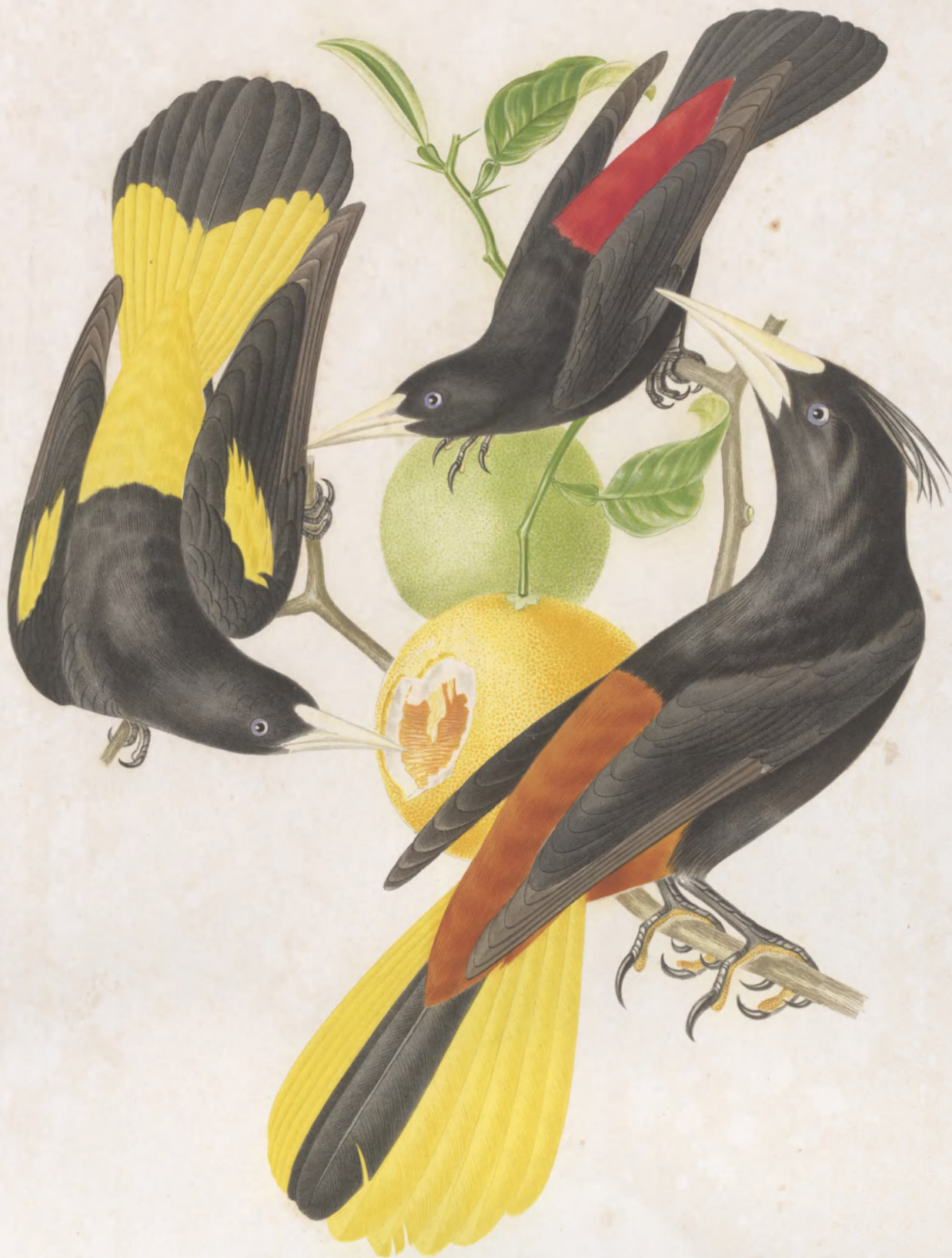
CASSINUS HEMORRHOUS ————— ICTERONOTUS ————— CRISTATUS