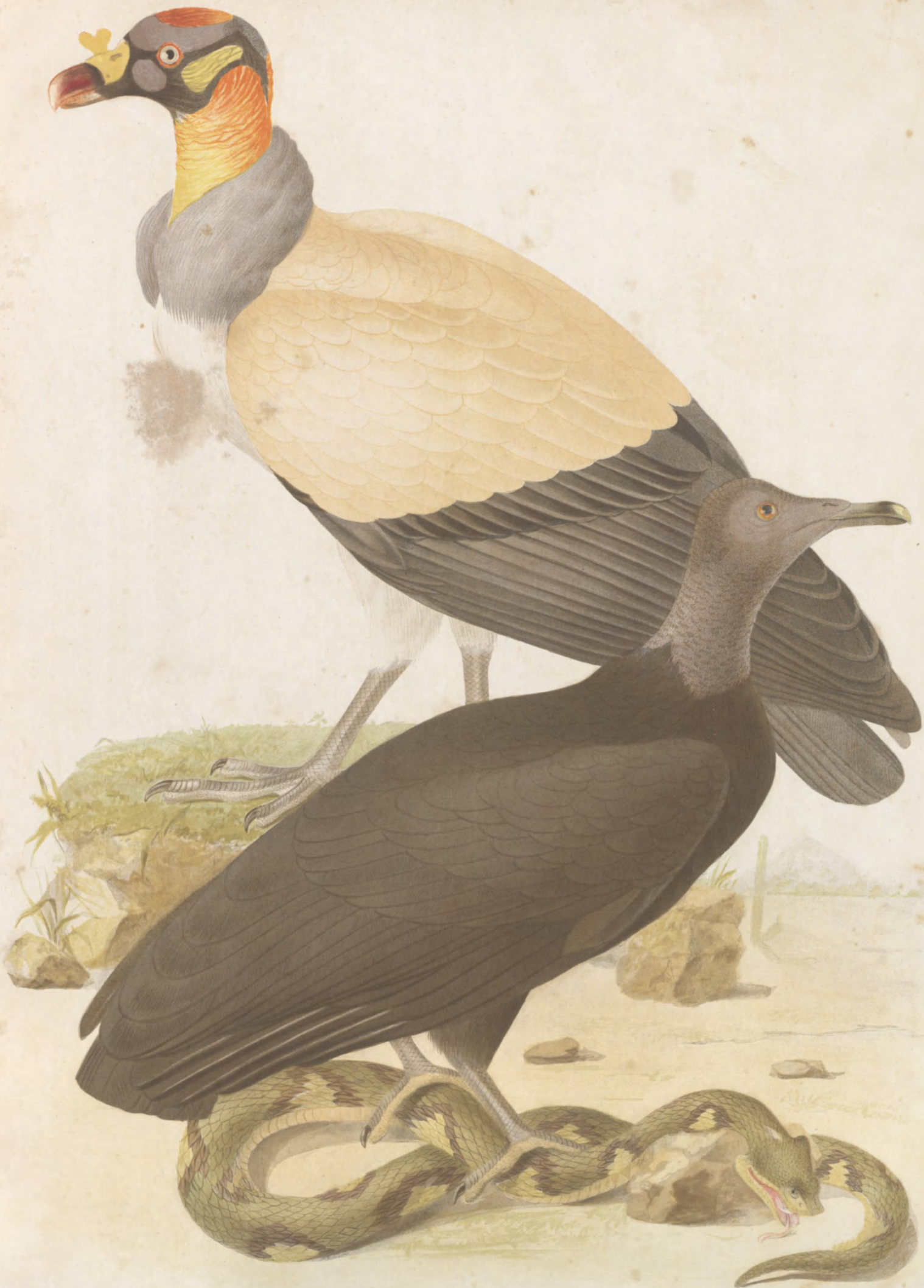
SARCORAMPHUS PAPA ♀ PERCNOPTERUS JOTA ♀

LONDON: WATERMAN & SONS, PRINTERS - LITHOGRAPHERS