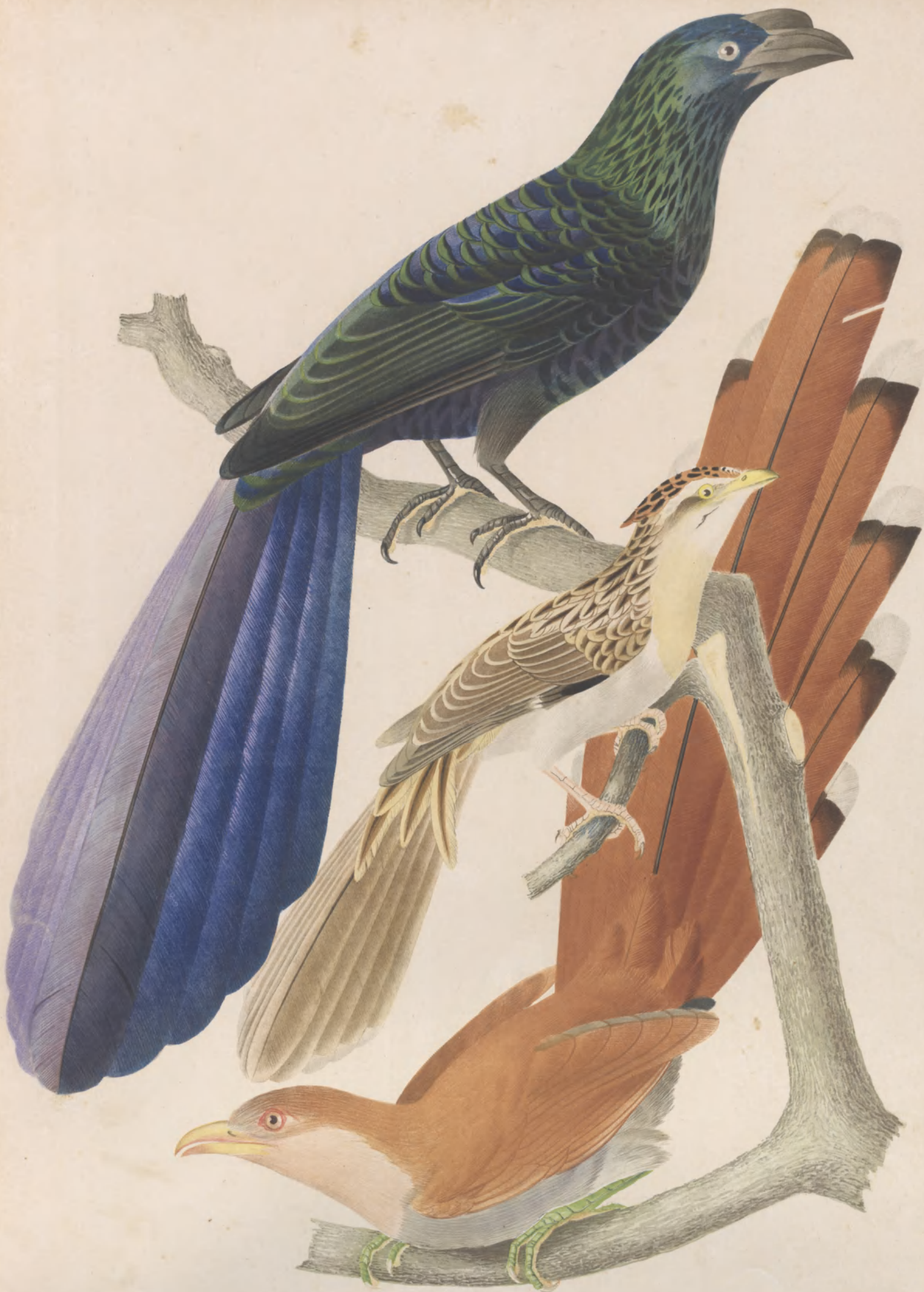
CHALCOPHAPS MALE CORYZUS AETHIUS JAVANES