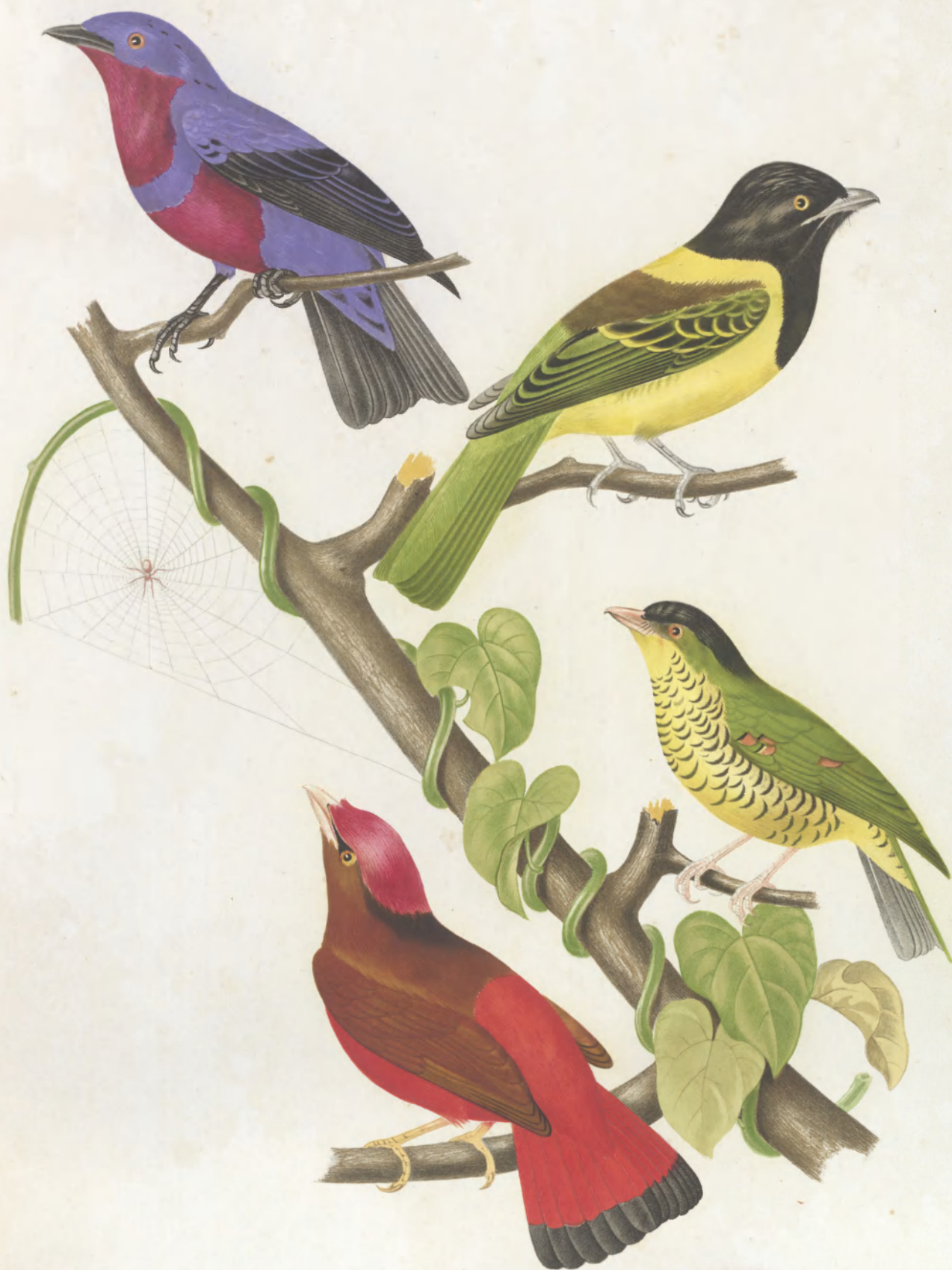
AMPELIS, FASCIATA ——— CUCULLATA ——— ARCUATA ——— CARNIFEX