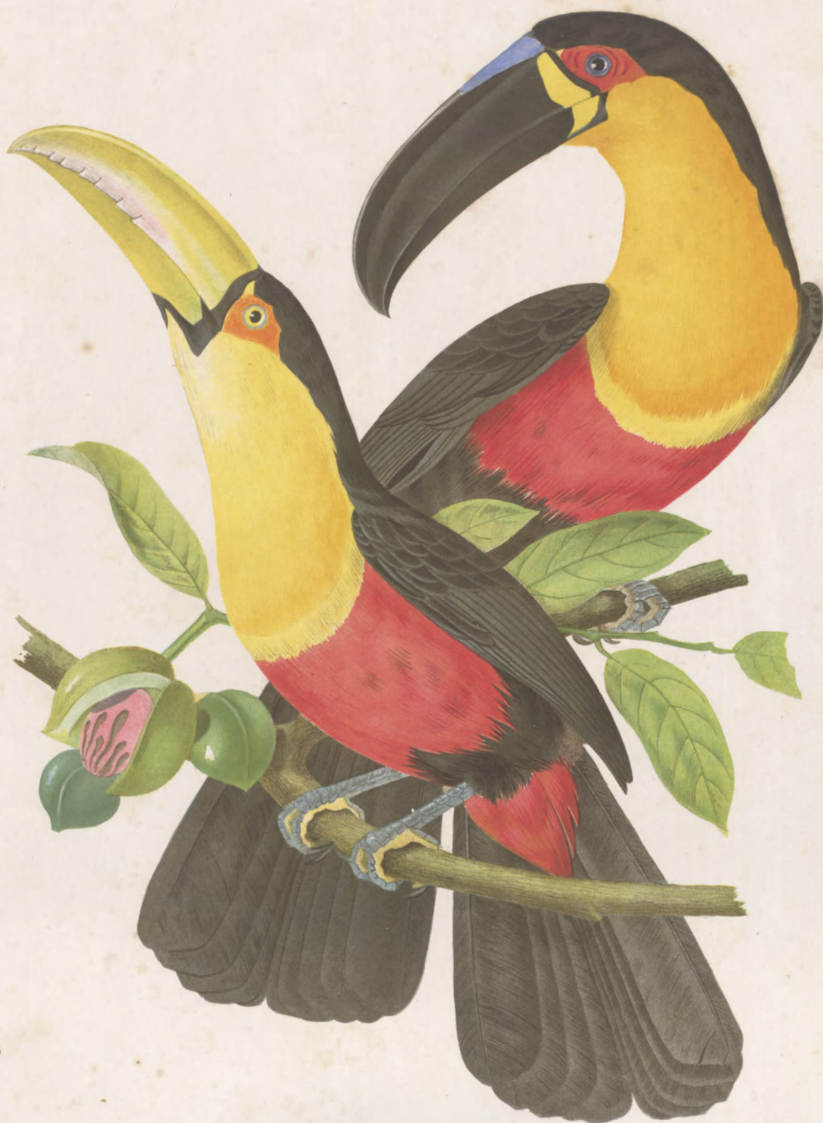
RAMPHASTOS ARIEL DISCOLORUS.