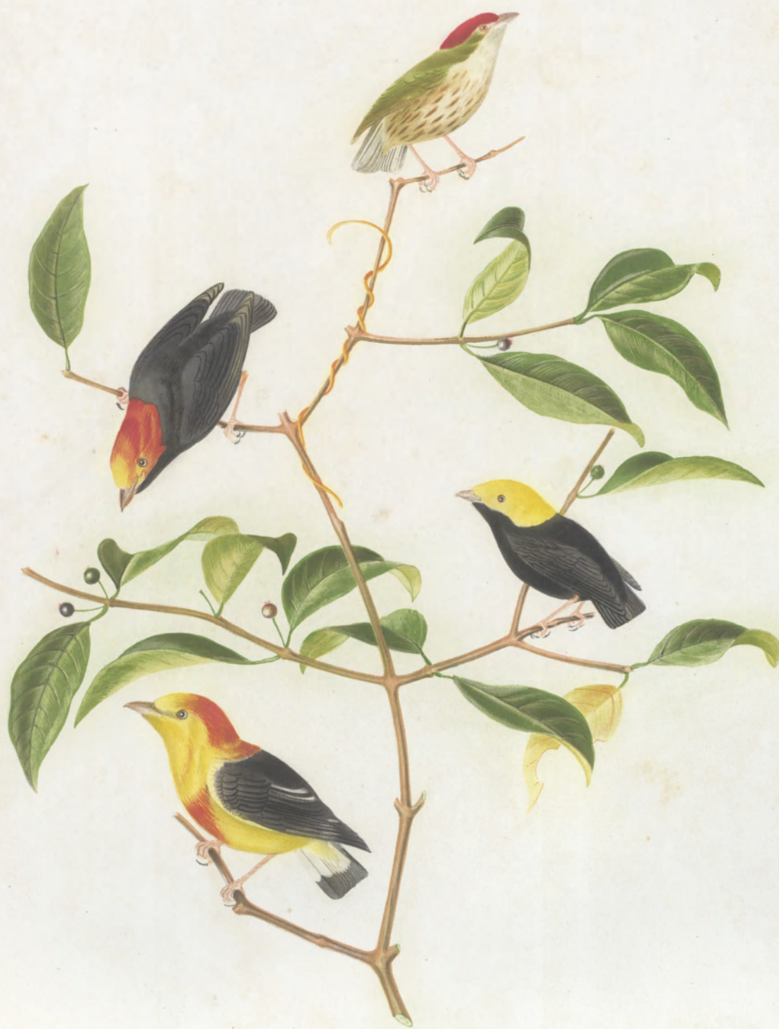
PIPRA STRICILLATA —— ERYTHROCEPHALA —— CHRYSOCEPHALA —— AUREOLA