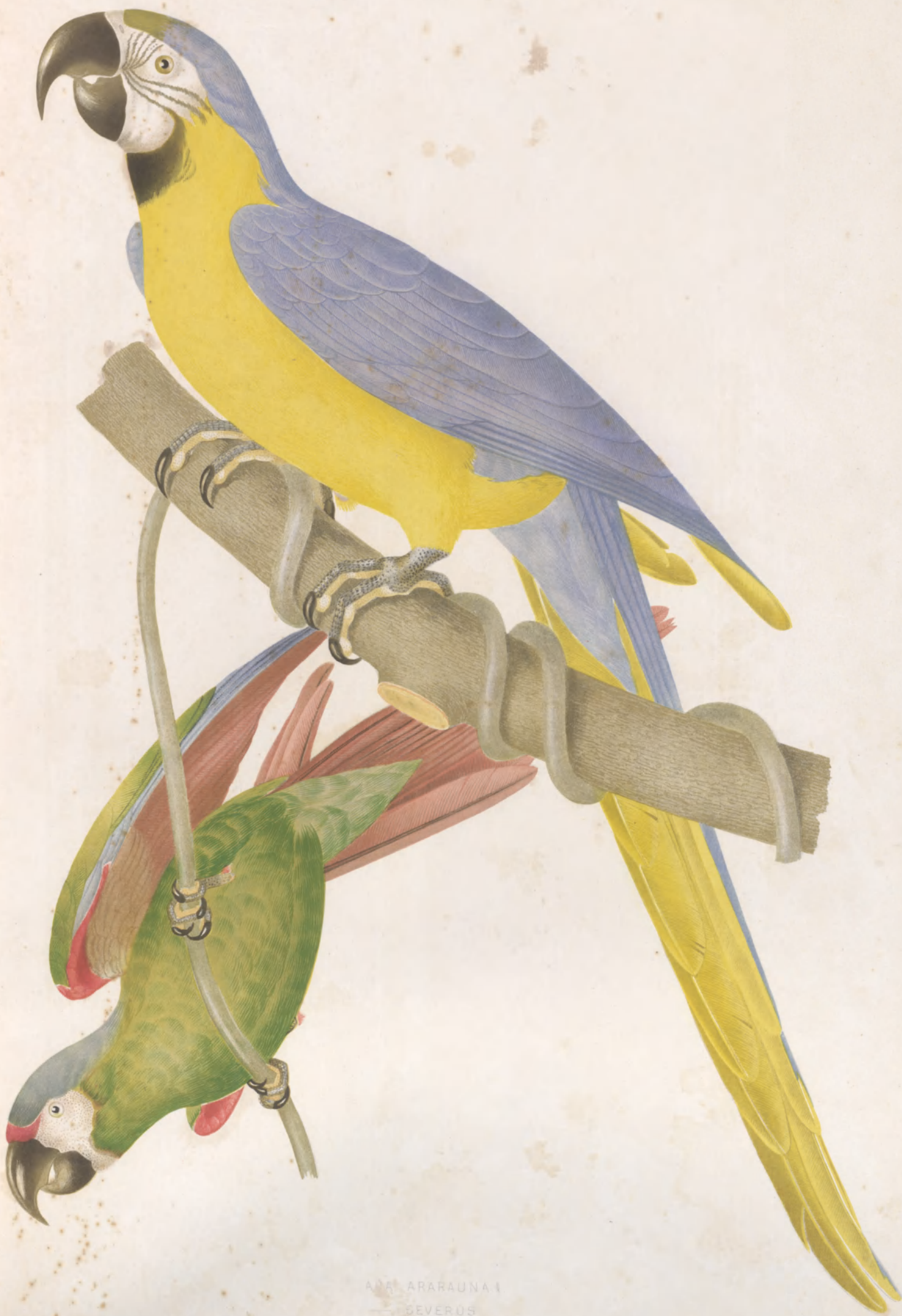
ARA ARARAUNA — SEVERUS