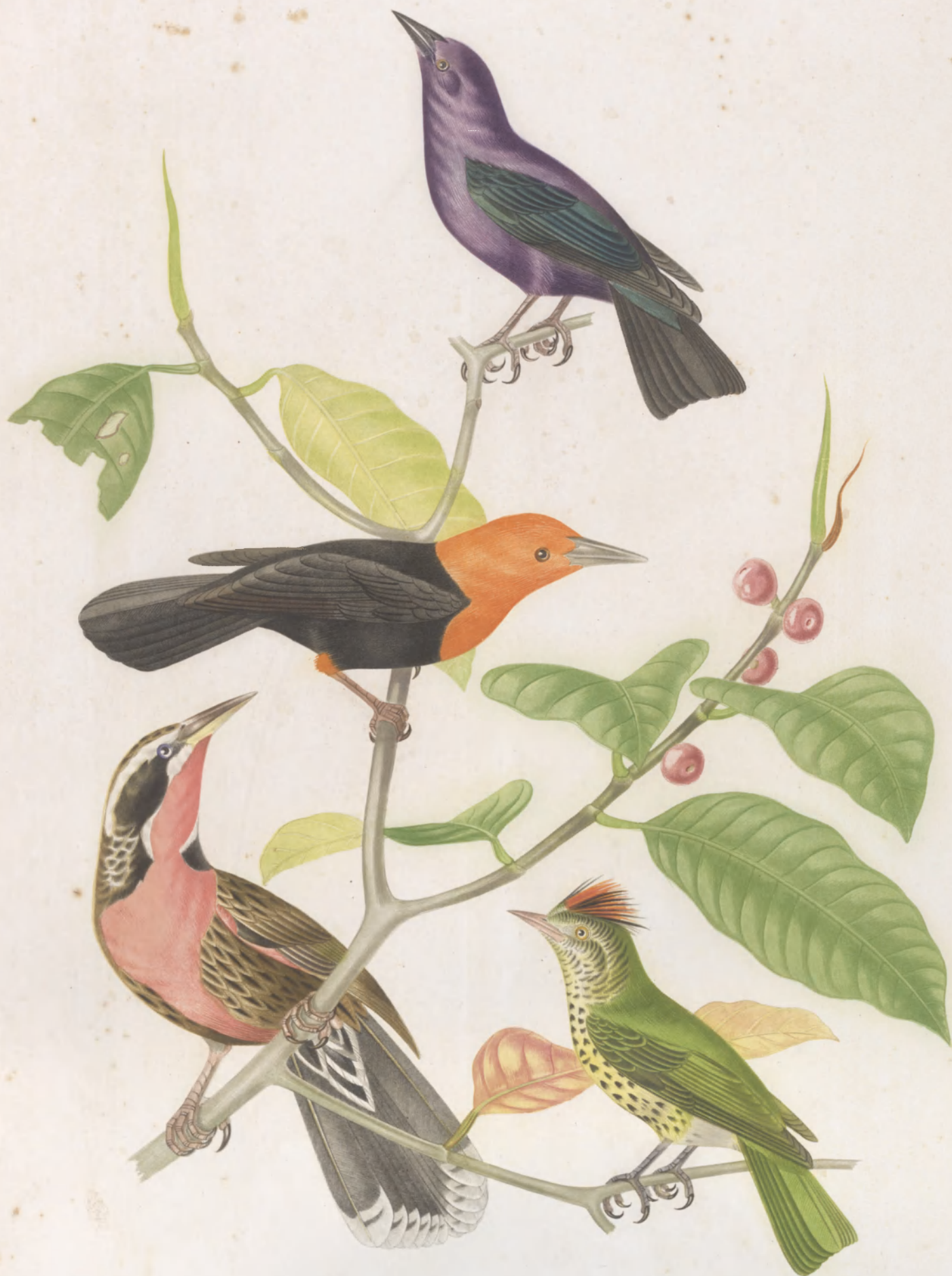
ICTERUS VICIACEUS STURNUS RUBER MILITARIS OXYRHYNCHUS FLAMMEICEPS

JOHN WATSON & SONS, CHROMO LITHOGRAPHERS