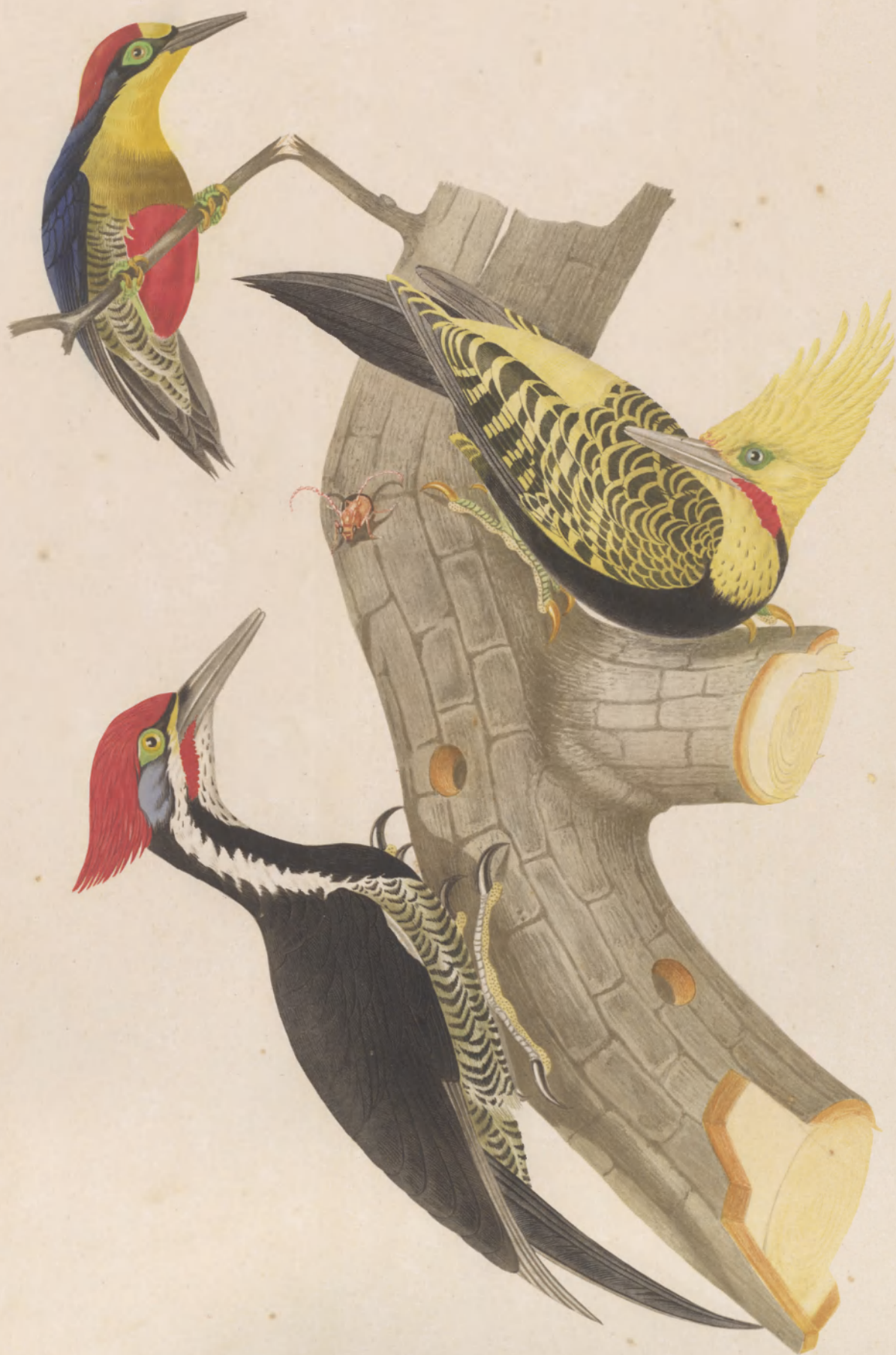
PICUS ERYTHROGASTER — FLAVESCENS — ERYTHROCEPHALUS