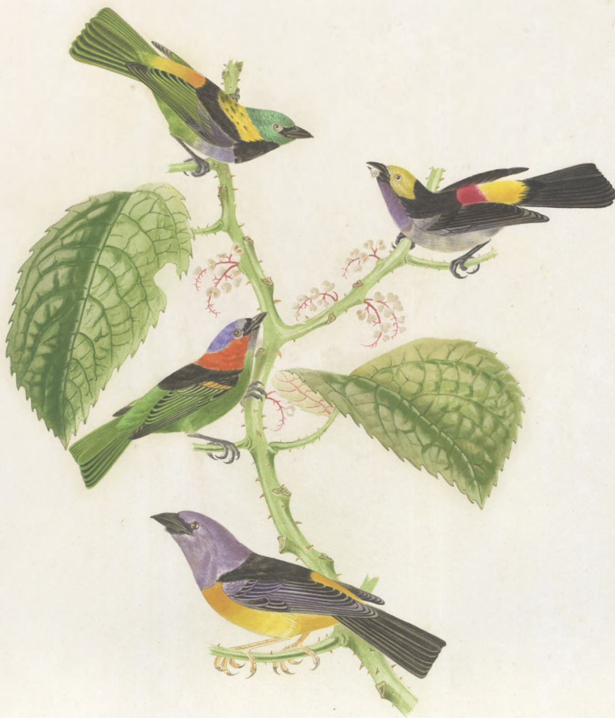
TANACRA TRICOLOR TALAO MULTICOLOR CHRYSOCAETER