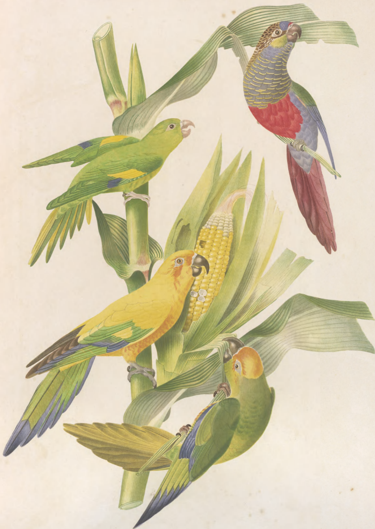
CONURUS CRUENTATUS ——— XANTHOPTERUS ——— CUARUBA ——— AURIFRONS