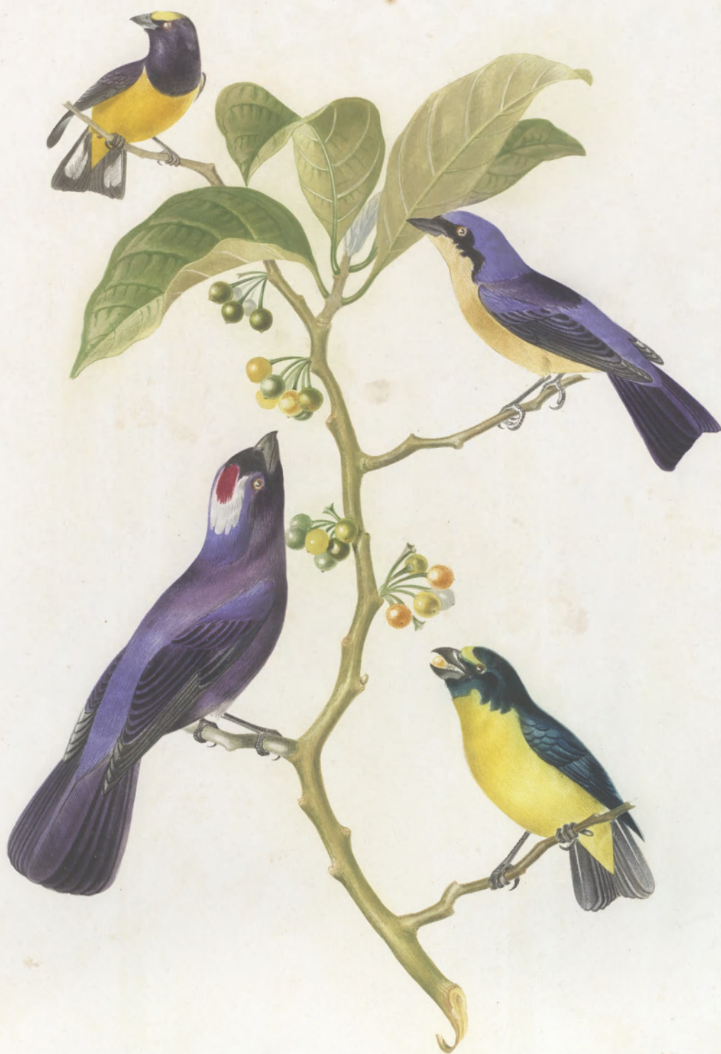
EUPHONIA CHLOROLICA. ——— VITTATA ——— DIADEMATA ——— PSITTACINA

LONDON. WATERLOW & SONS, CHROMO-LITHOGRAPHERS