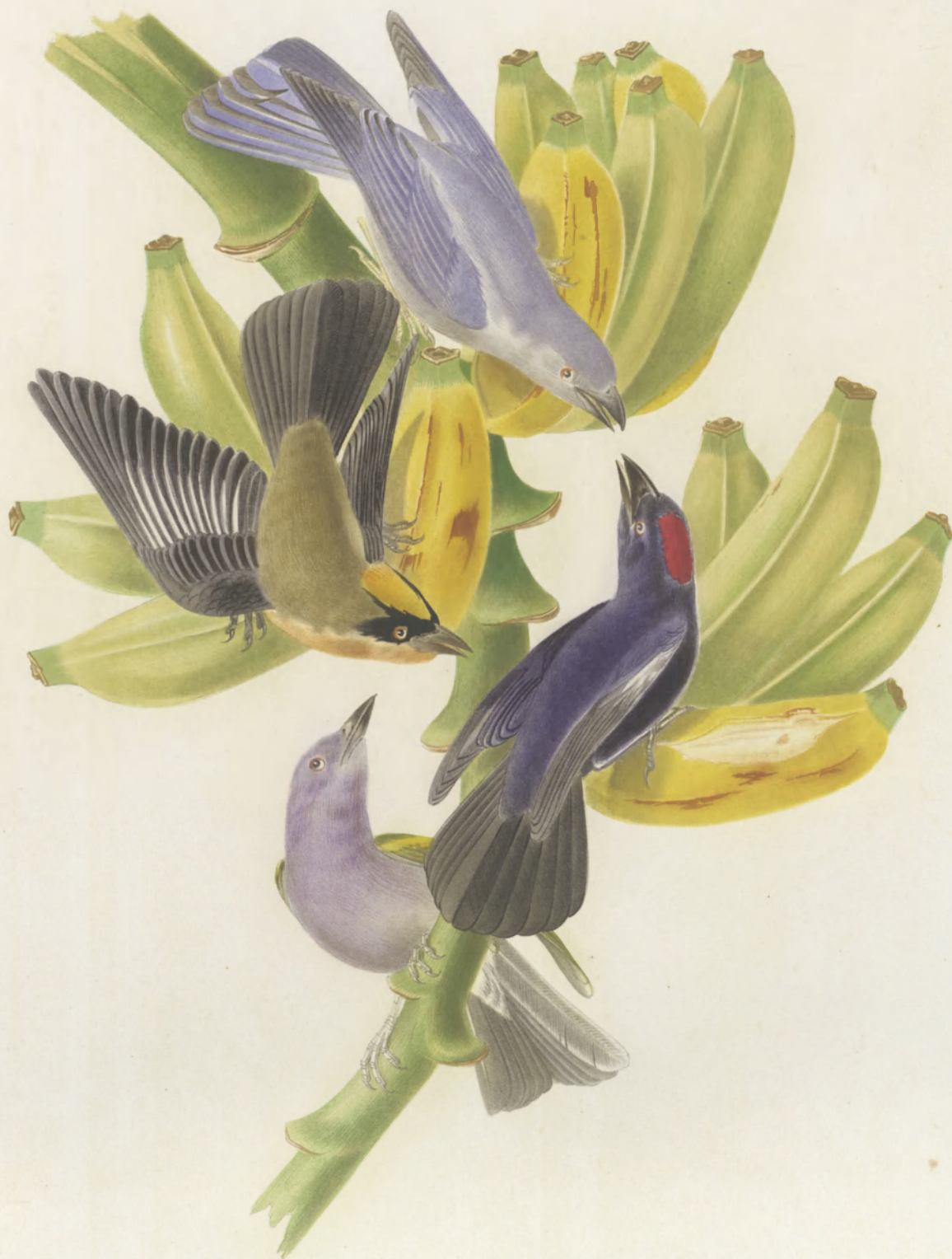
TACHYPHONUS EPISCOPUS _____ AURICAPILLUS _____ PYROCEPHALUS _____ ARCHIEPISCOPUS