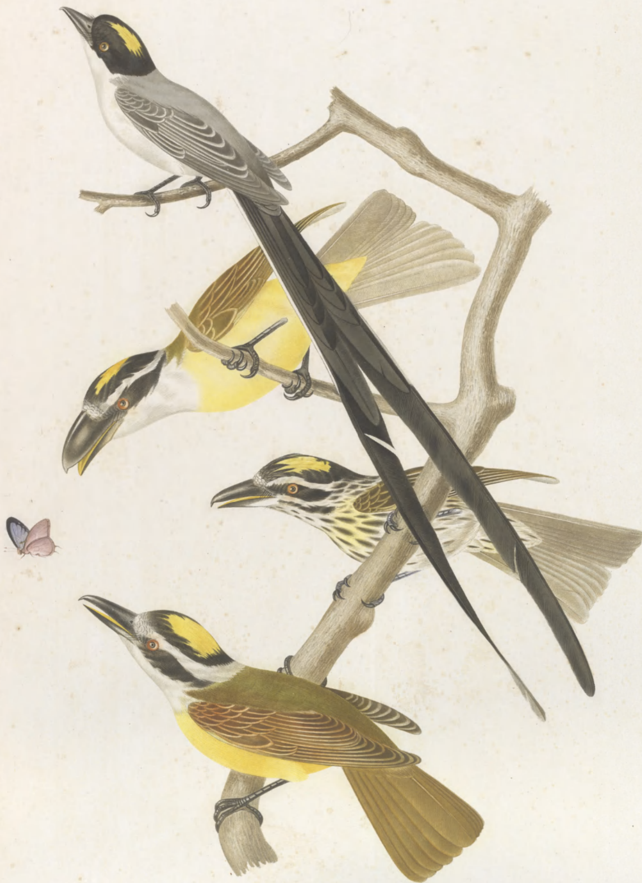
TYRANNUS FORTICATUS. PITANCA. AUDAX SULPHURATUS