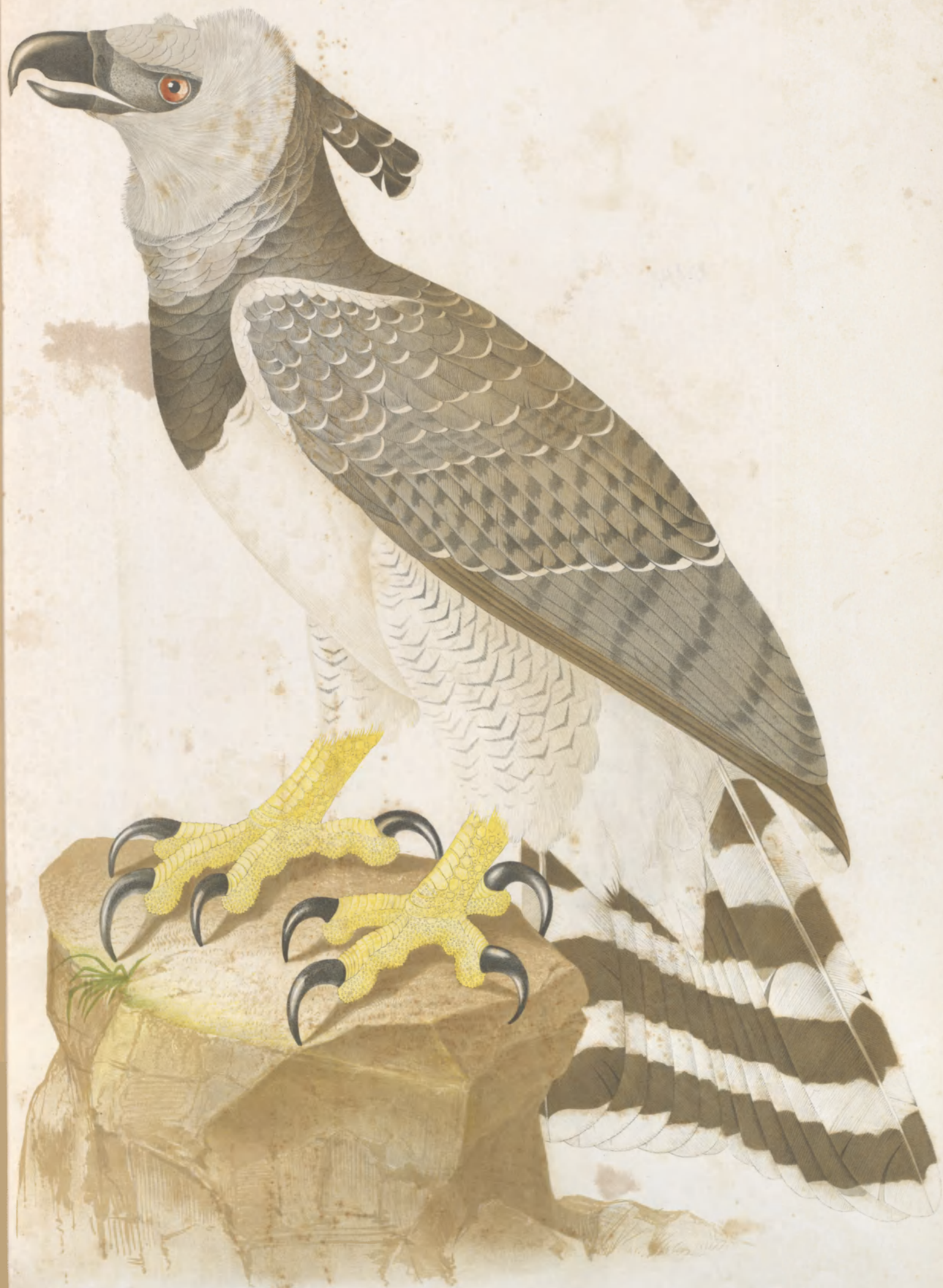
HARPVIA CRISTATA L.

LINEA. BAYARD. & DEL. G. BAYARD. LITH. PARIS.