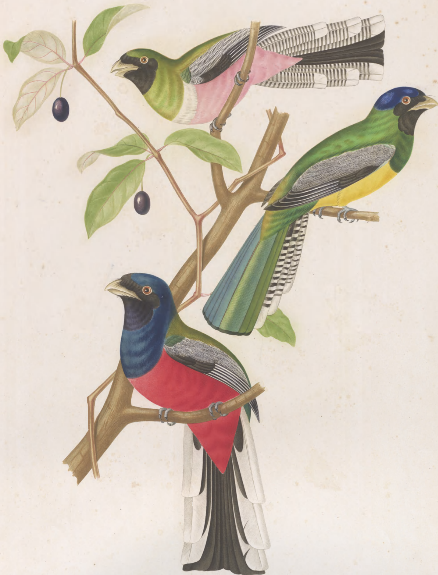
TROGON ROSALBA SULFUREUS VIOLACEUS