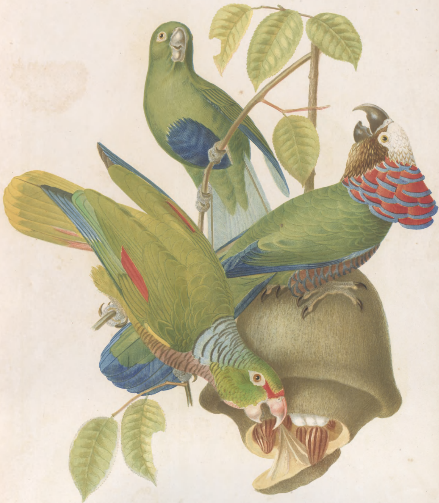
PSITTACUS CYANOCASTER ACCIPITRINUS VINACEUS

LONDON: WATERLOW & SONS CHROMO-LITHOGRAPHERS.