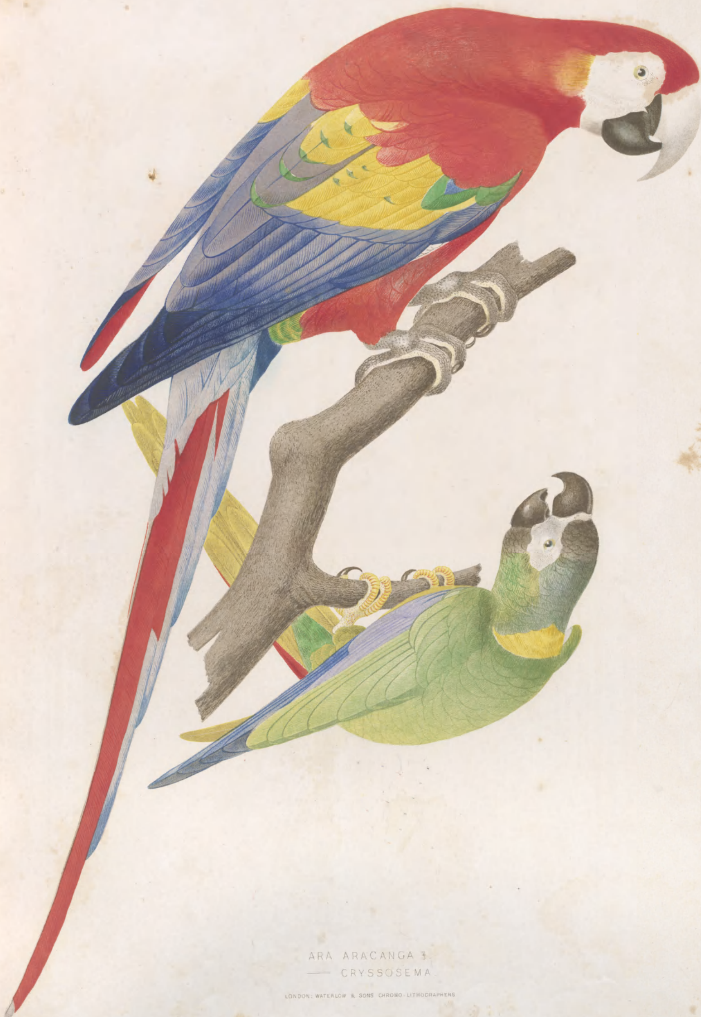
ARA ARACANGA 3. — CRYSSOSEMA

LONDON: WATERLOW & SONS CHROMO-LITHOGRAPHERS