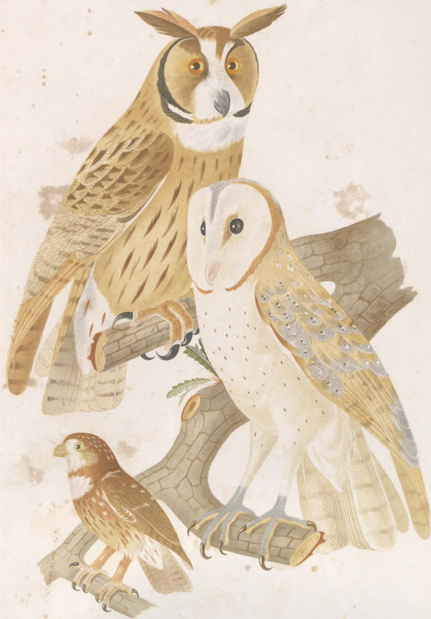
OTUS CLAMATOR STRIX PERLATA PUMILA