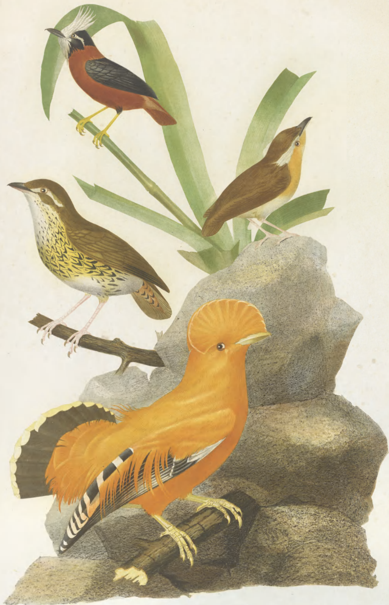
PITHYS LEUCOPS CONOPOMACHA LEUCOTIS MYOTHERA TINNIENS RUPICOLA AURANTIA