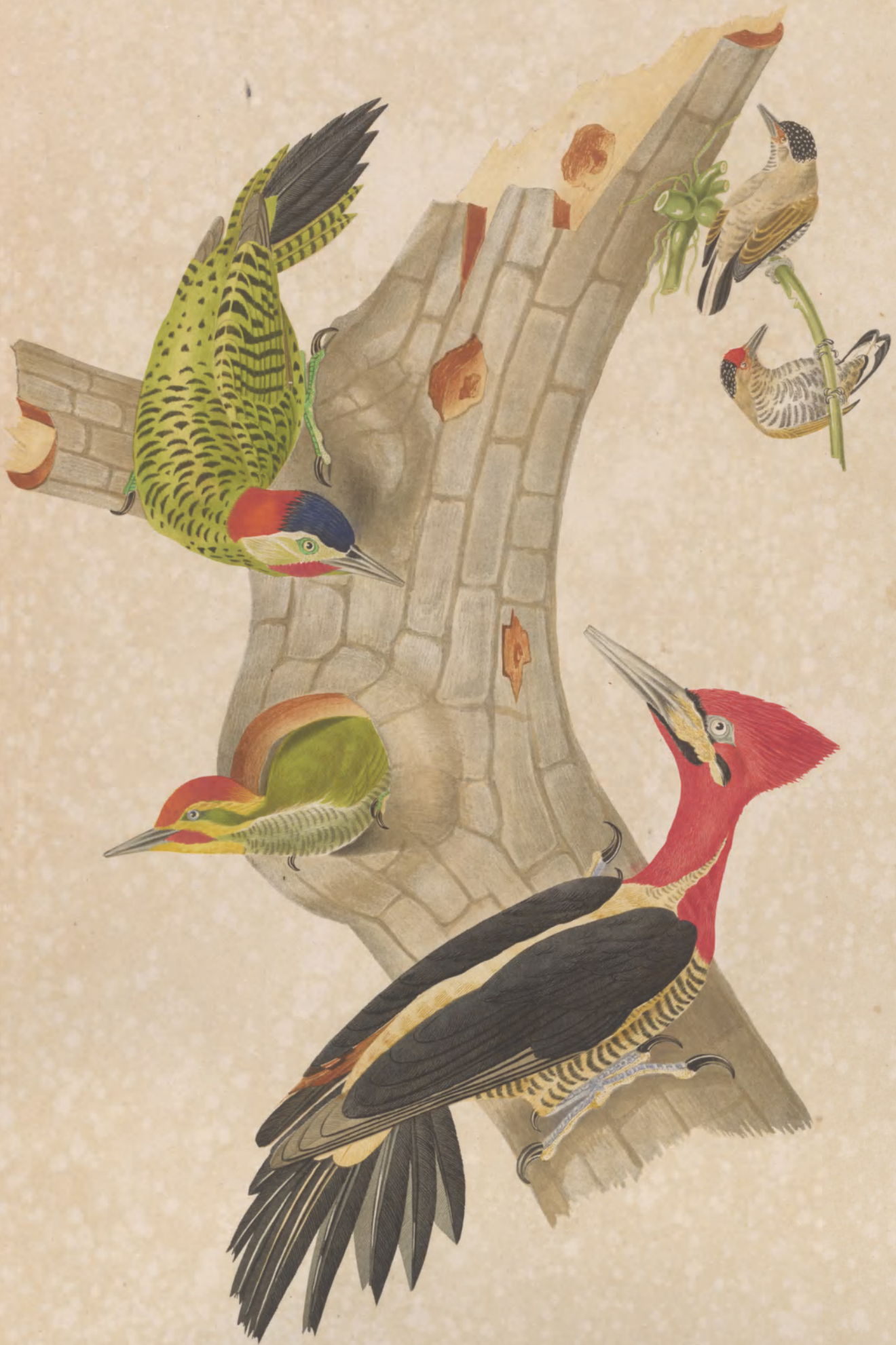
PICUMNUS CIRRHATUS PICUS MELANOCHLORIS ——— CHRYSOCHLORIS ——— RUBER