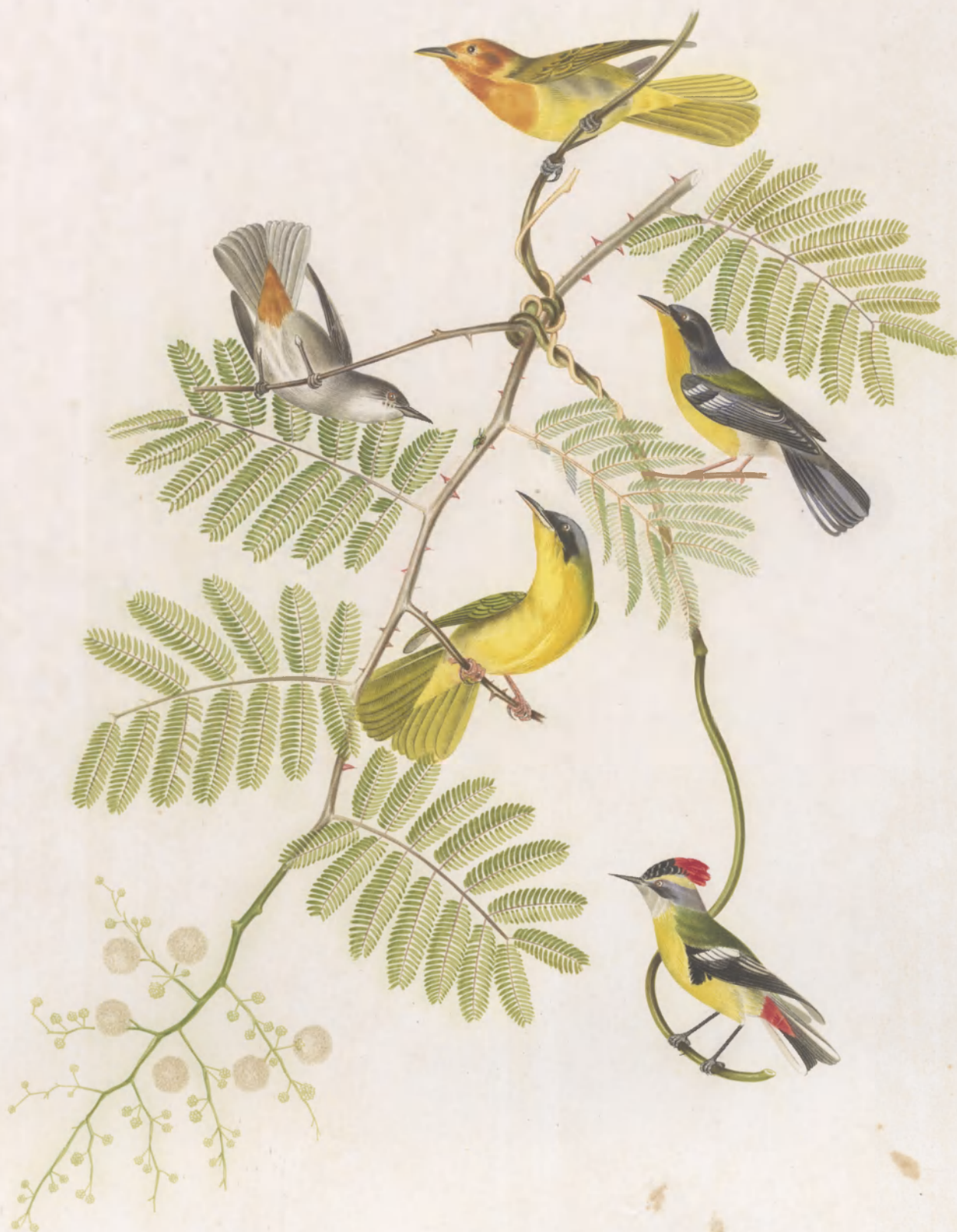
NEMOSIA RUFICOLLIS SYLVIA ERYTHROPUS ——— VENUSTA ——— TRICHAS REGULUS OMNICOLOR

LITHO. WATERMAN & SONS, CHICAGO, ILLINOIS