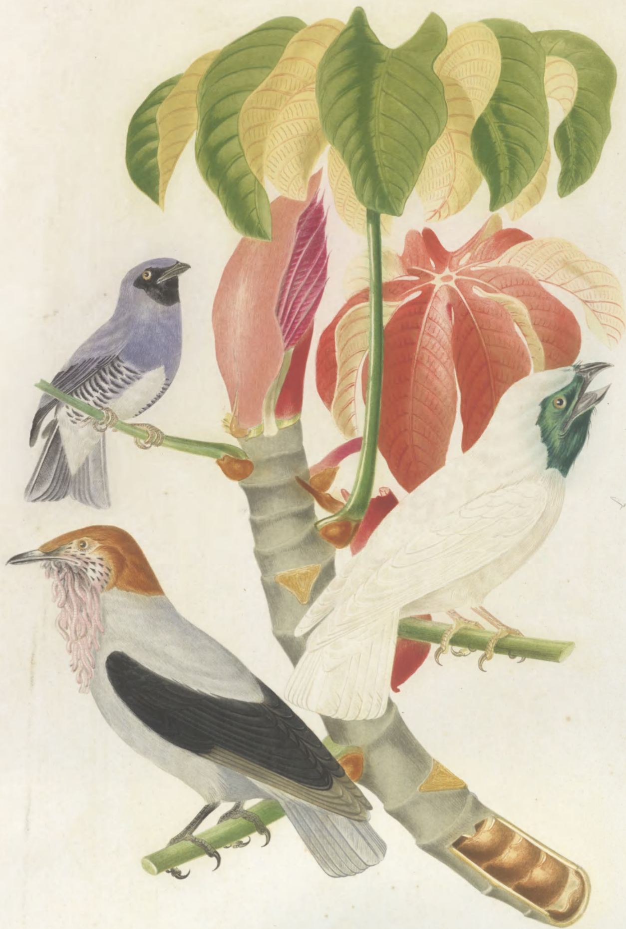
TERMINA CERULEA PROCNAS NUDICOLLIS VARIEGATUS

LONDON WATERLOW & SONS, CHROMOLITHOGRAPHERS.