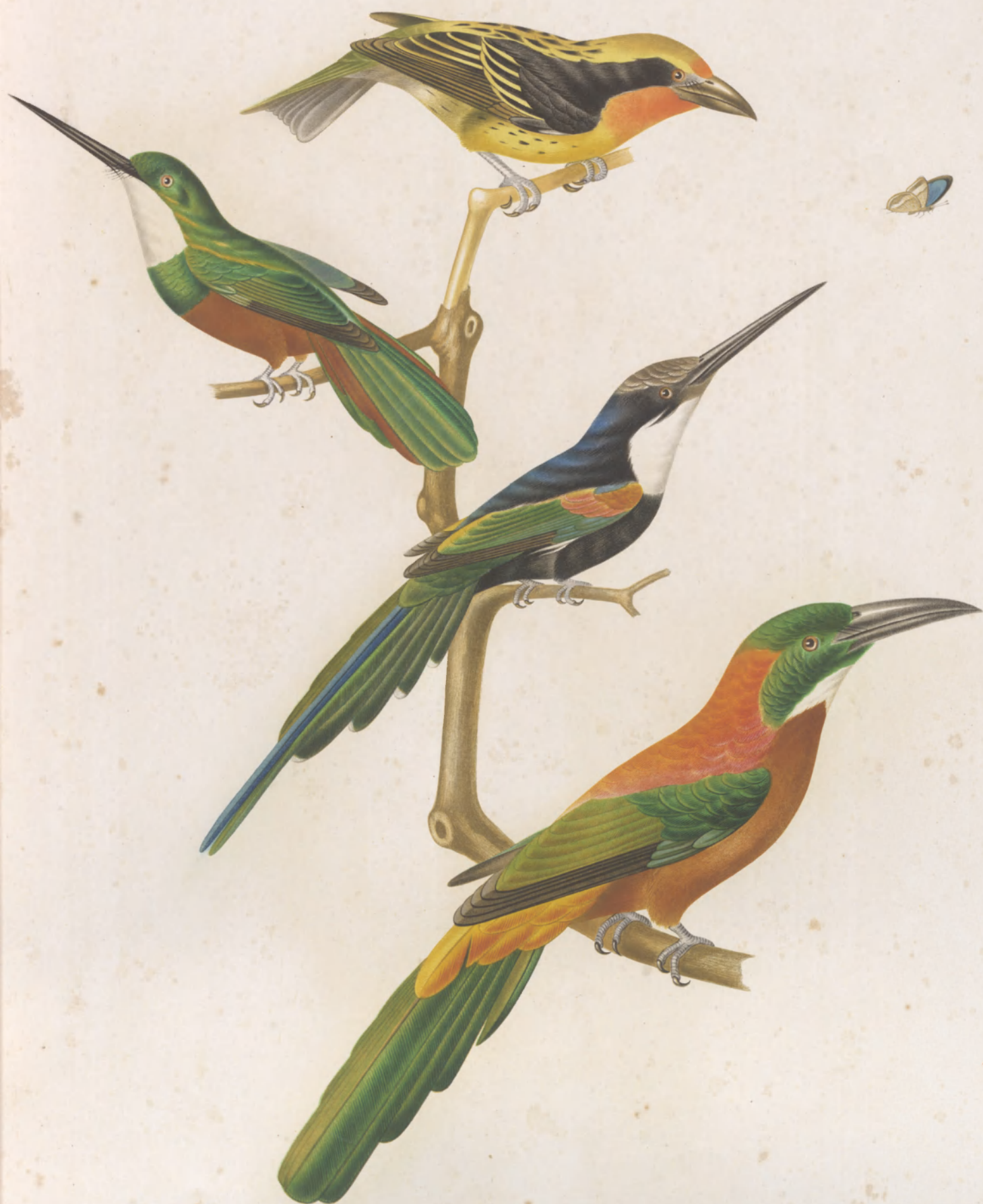
BUCCO CAYENNENSIS GALBULA VIRIDIS ——— PARADISEA JACAMEROPS GRANDIS