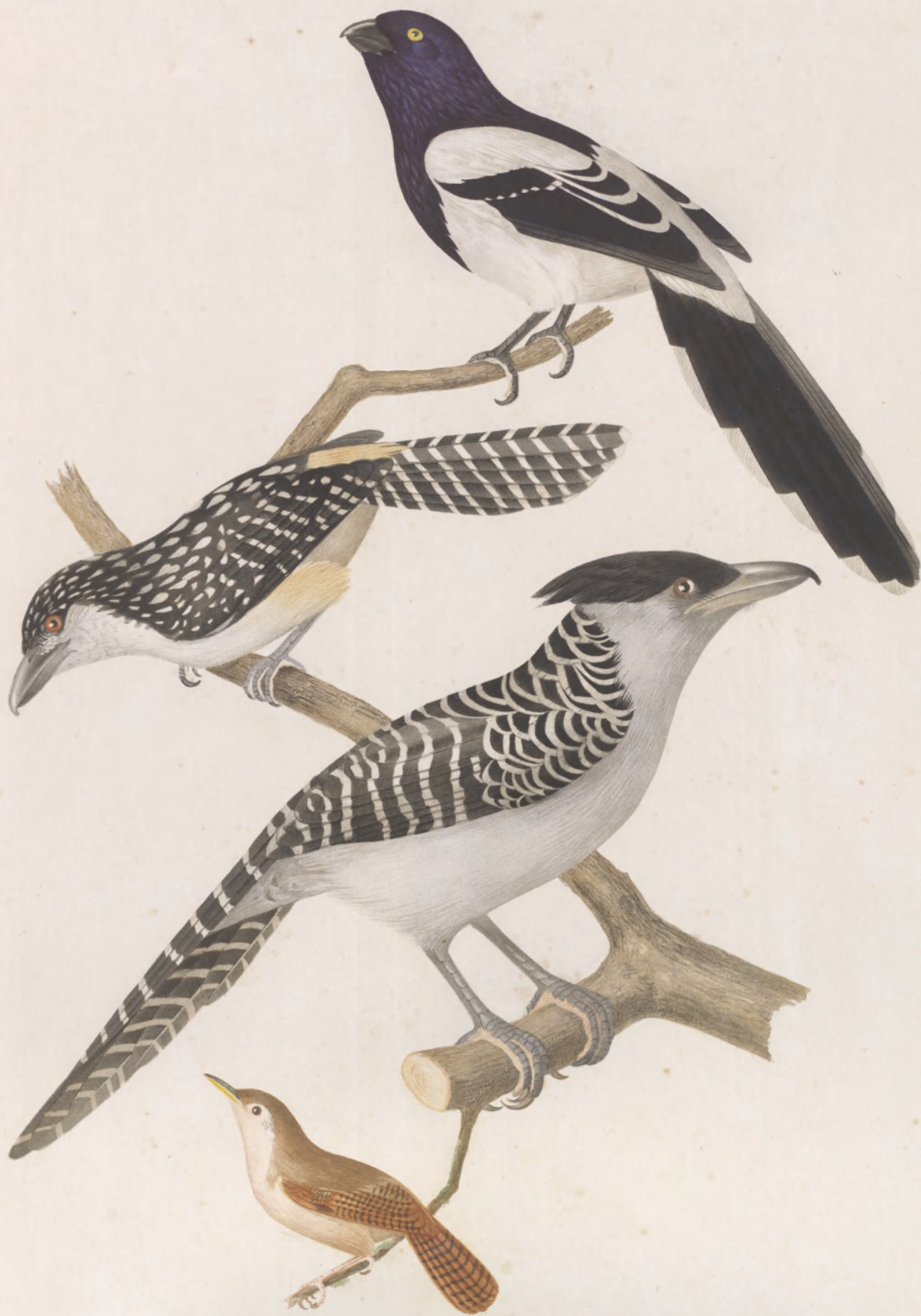
BETHYLUS PICATUS TAMNOPHILUS GUTTATUS FASCIATUS TROGLODITES PLATENSIS LONDON: WATERLOW & SONS, CHROMO LITHOGRAPHERS