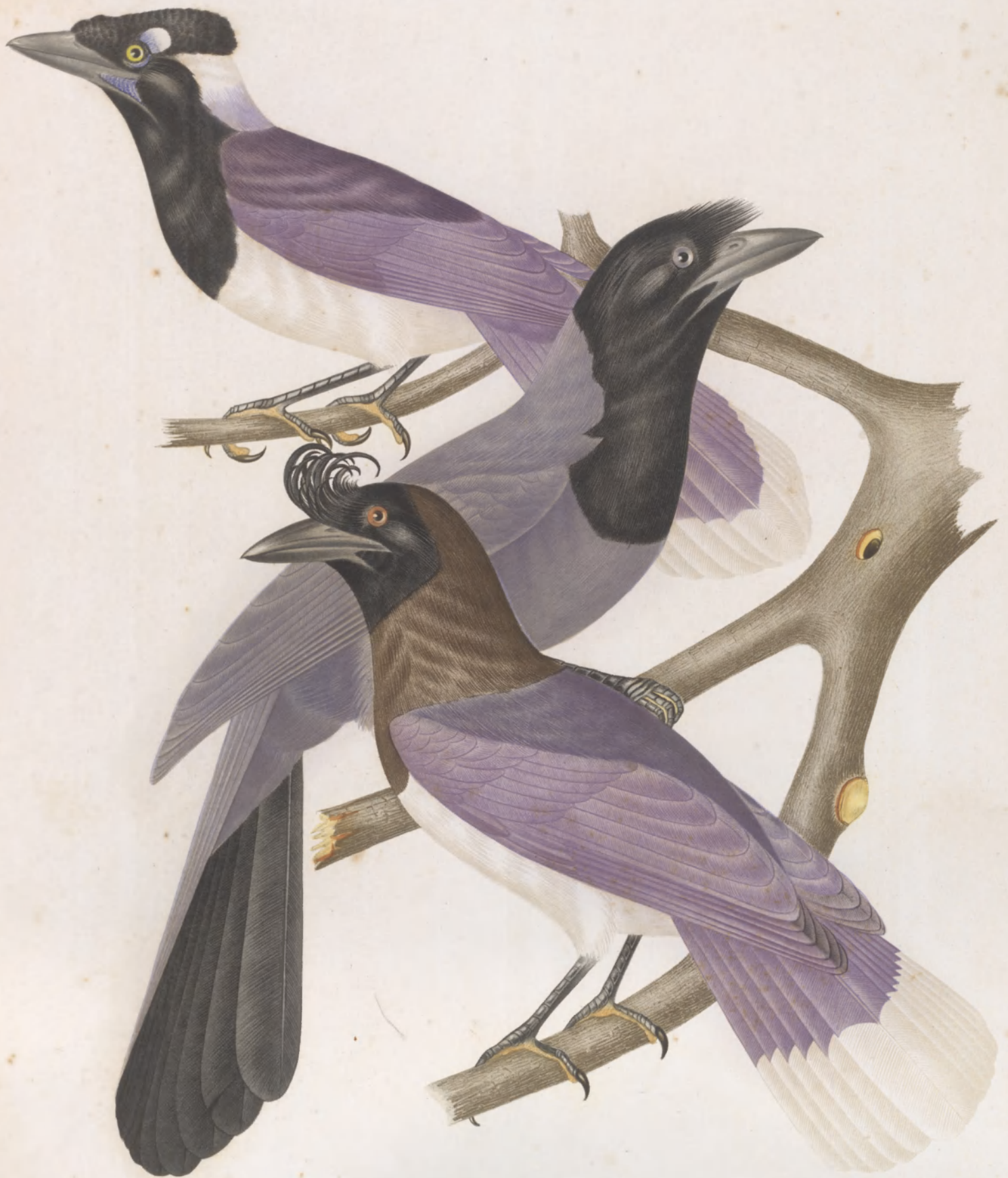
PICA CHRYSOPS AZUREA CARRULUS CRISTATELLUS

LONDON: WATKINS & SONS, 1840. (1841) (1842)