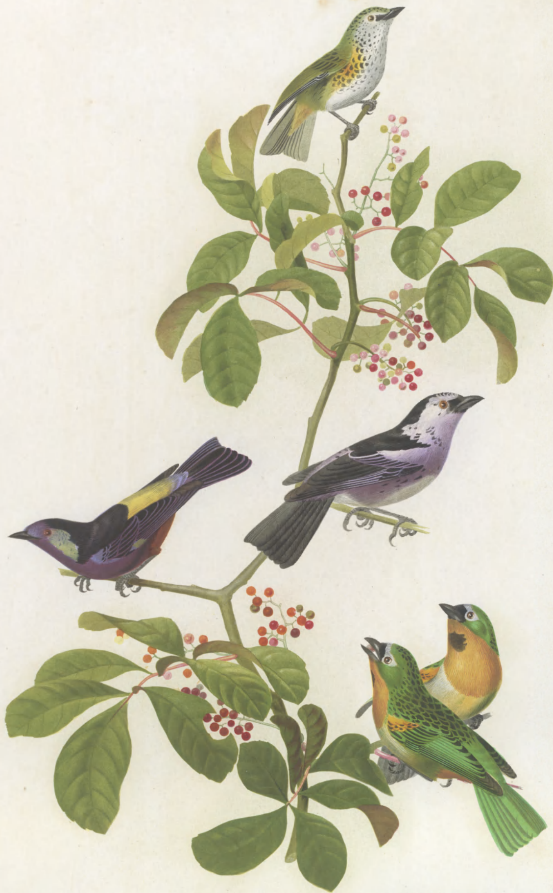
TANAGRA PUNCTATA ——— BRASILIENSIS ——— VARIA ——— THORACICA