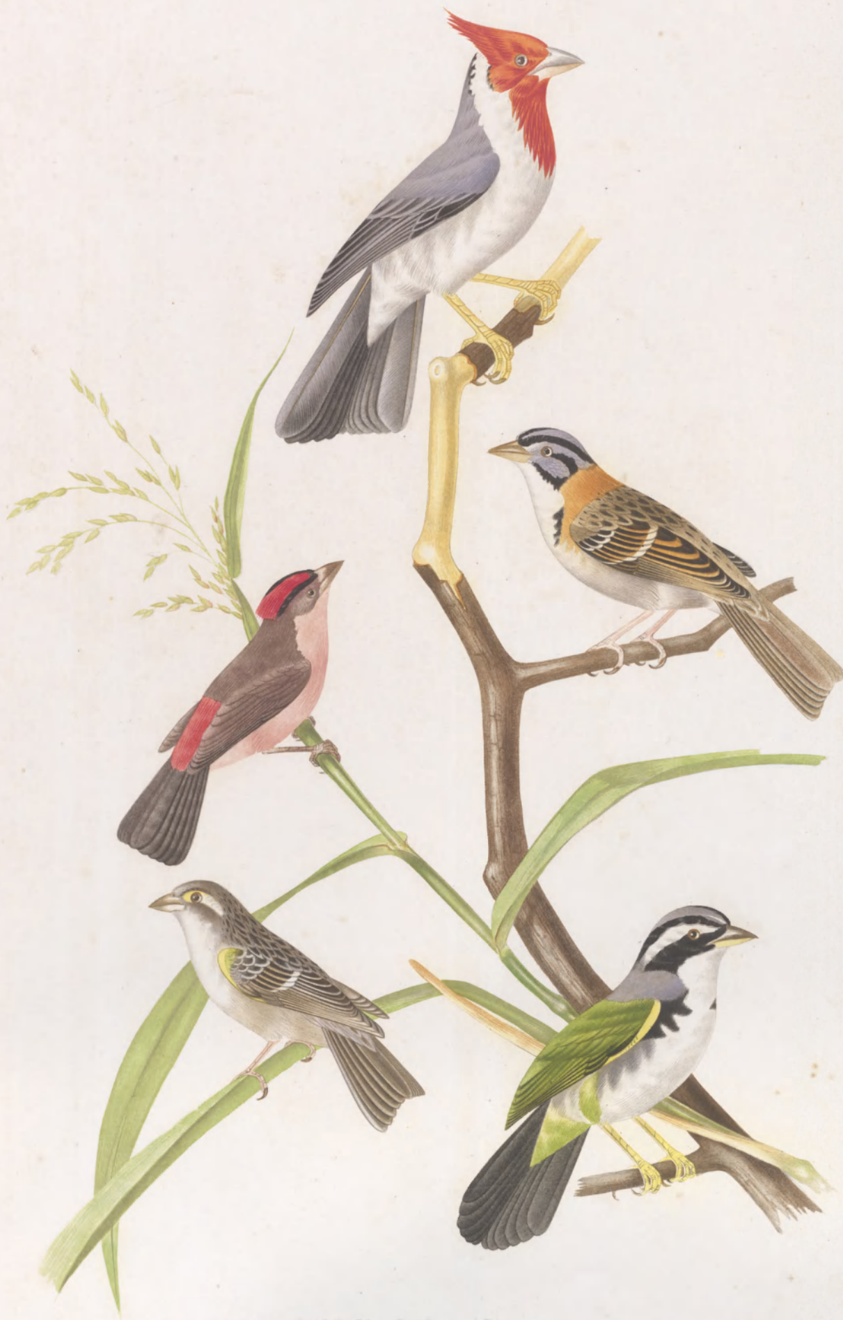
PYROGITA CUCULLATA ——— RUFICOLLIS ——— CRISTATELLA LINARIA CHLOROSCAPULIS EMBERIZA SILENS.