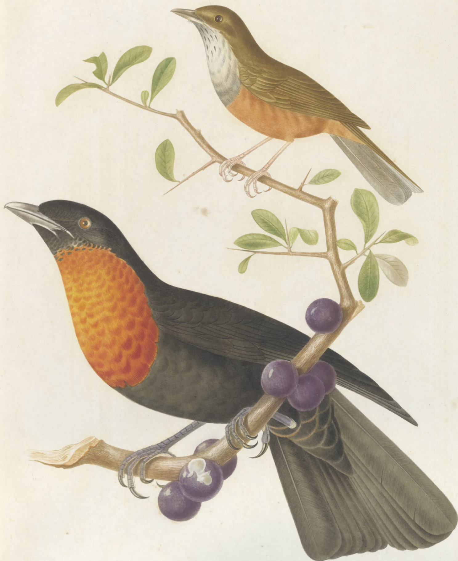
TURDUS RUFIVENTER CORACINA SCOTATA