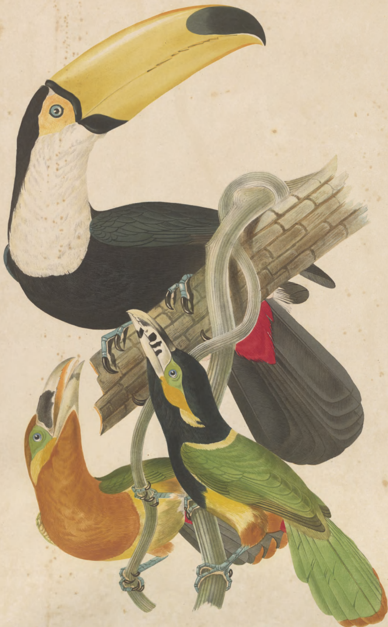
RAMPHASTOS TOCO PTEROCLOSSUS PLERIVORUS.