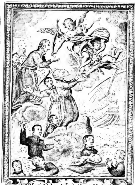
VVP. Ignatius de Azevedo Larit. et Socy 29. S. I. ad predicandum Xh. Euangelium in Brasilia missi pro Fide occiduntur ab Here- tici, et in mare prostrantur 1. July 1570.