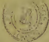
Figura 4, n.º 1.º representa hum tumor analogo ao da figura 3, e com que algumas crianças Vaccinadas tem sido perseguidas. Veja-se pag. 81, 82.

Figura 3, n.º 1.º representa hum tumor mormoso à que são sujeitos estes, e outros animaes.