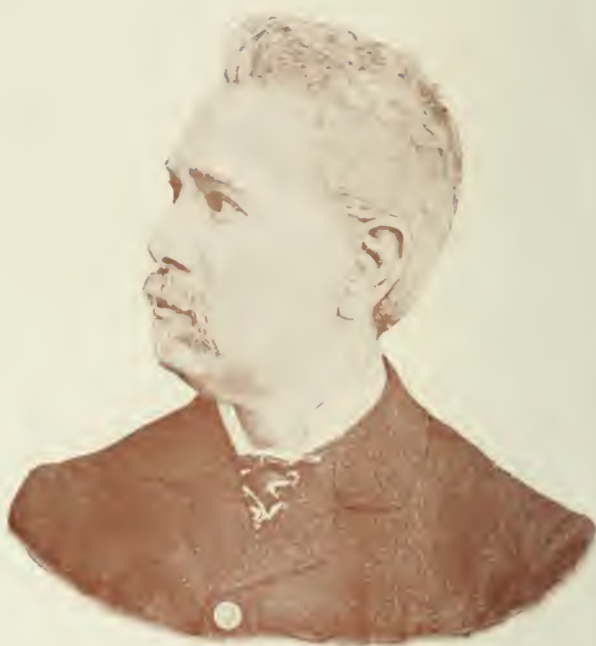
Dr. Theophilo Braga