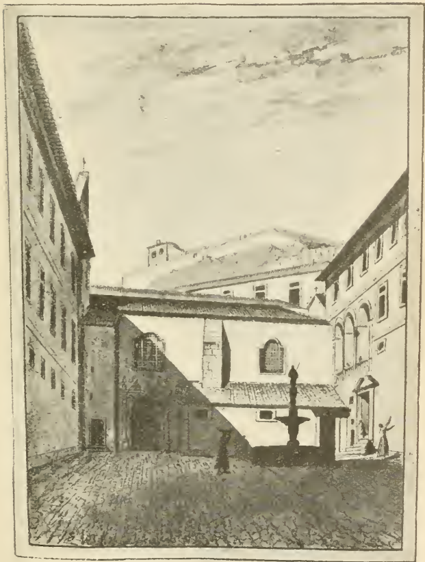
Antigo convento de Monchique, no Porto

aspecto de que em 1891 mal se podia fazer idea pelas